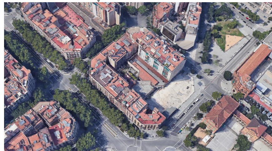
Àmbit de modificació de PGM any 2003