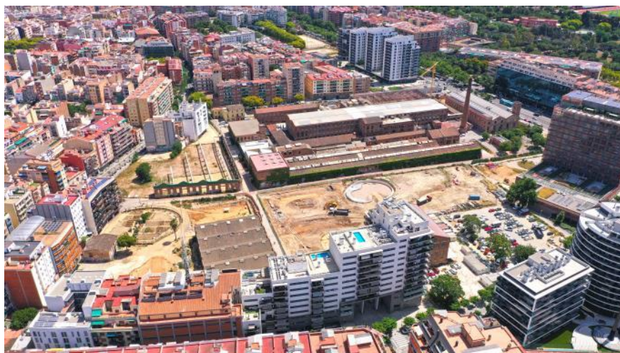
Vista aèria de l'estat actual del recinte de Can Batlló