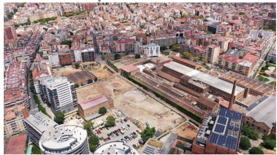
Qualificacions de la MPGM