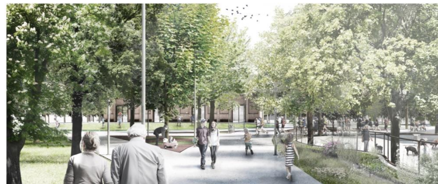
Espai lliure central de Can Batlló.