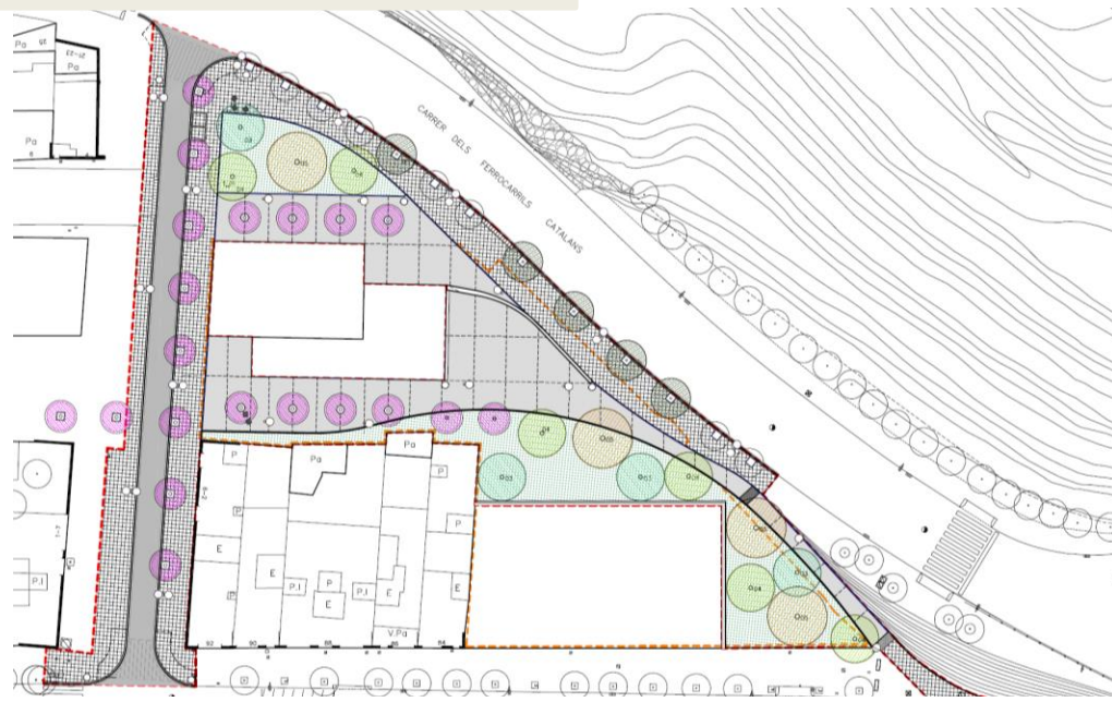
Projecte d'urbanització de la UA 1 i fora àmbits