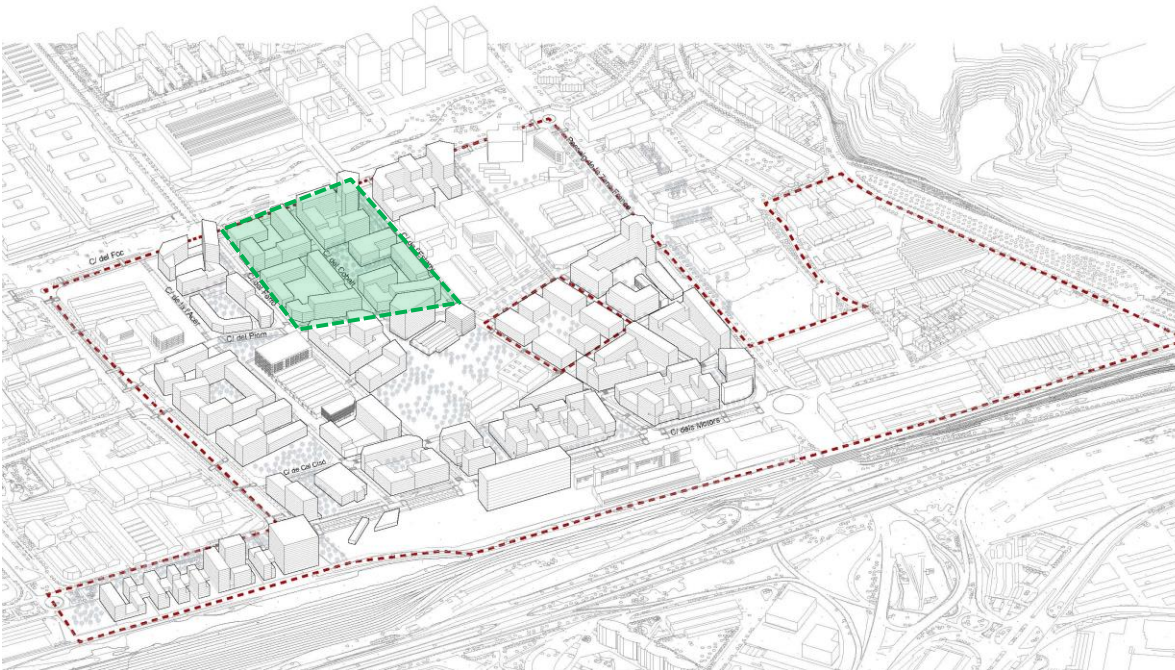
Vista aèria del Sector 3