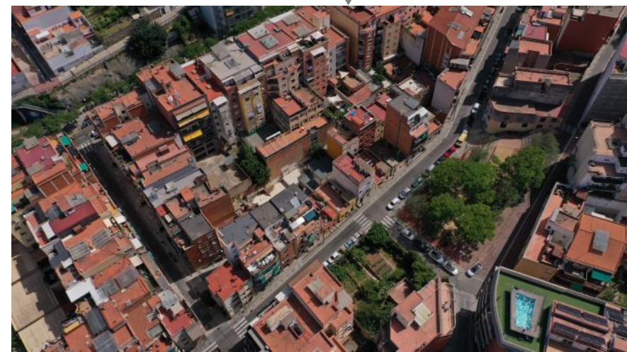
Modificació de PGM