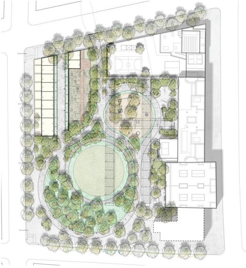
Urbanització de la zona verda a l'illa de Montnegre, Equador, Taquígraf Serra i Entença