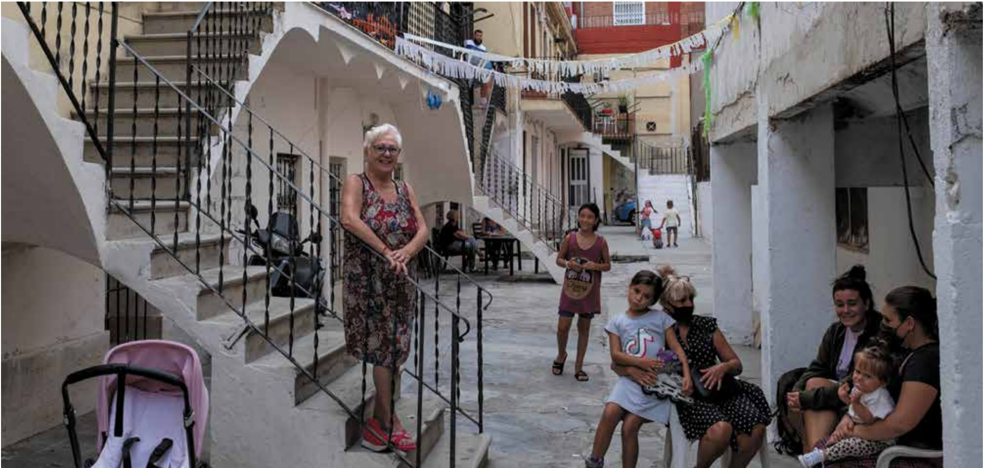
Veïnes de Can Bausili fan petar la xerrada al carrer, en l'ambient familiar que caracteritza les relacions entre el veïnat dels nuclis de la colònia Bausili i Eduard Aunós.