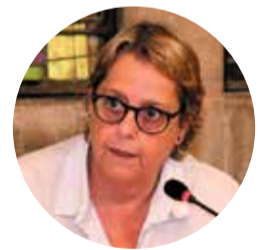
Maribel Sánchez Loran, Consellera del PSC al districte de Sants-Montjuïc