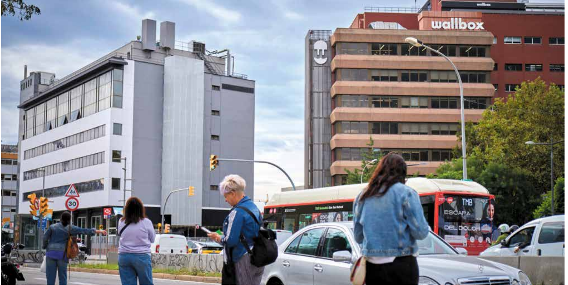
Conjunt d'edificis a l'entrada del Prat Vermell on s'hi instal·len nombroses oficines i els centres logístic d'algunes empreses.