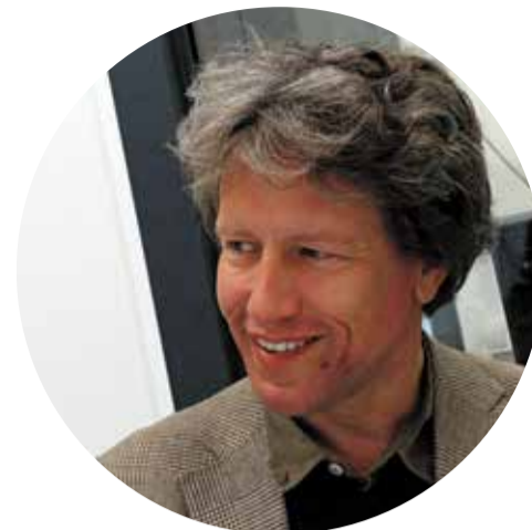
Sander Laudy Bo1 Arquitectes