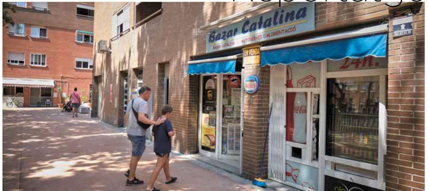
Botiga de queviures, un dels serveis al Prat Vermell que celebra l'augment del dinamisme econòmic arran l'arribada de nous veïns i veïnes.

La previsió és que en les pròximes dècades a l'espai en transformació s'apleguin entre 8 i 10 mil llocs de feina. Es treballa des d'ara i durant els pròxims anys en diverses actuacions per millorar els serveis a les empreses i els seus treballadors i amb l'objectiu de contribuir a consolidar la zona com a pol tecnològic de referència.