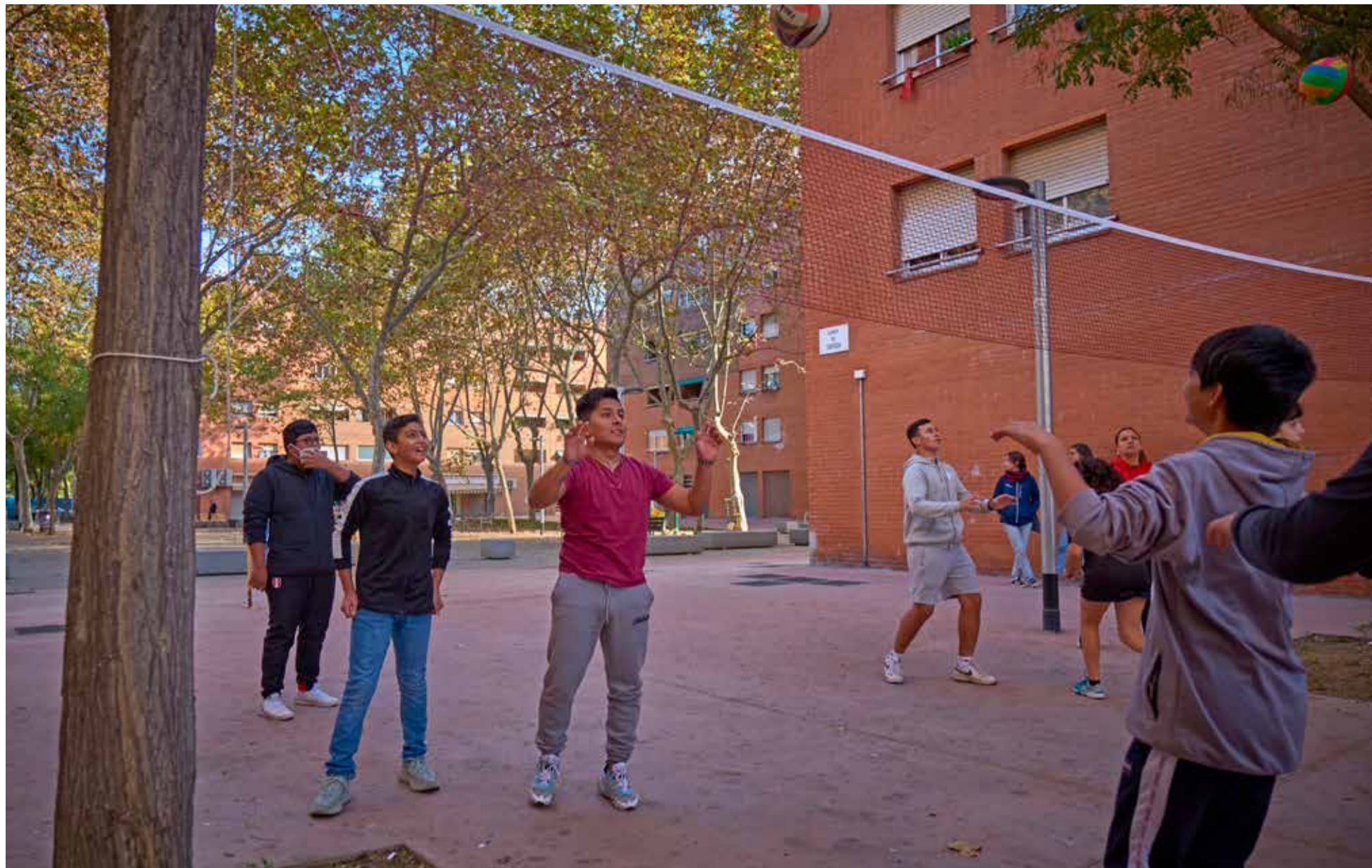
El jovent d'Eduard Aunós fent esport a una pista de vòleibol improvisada a la plaça Falset, durant la Festa dels Drets dels Infants organitzada per l'Imagina't