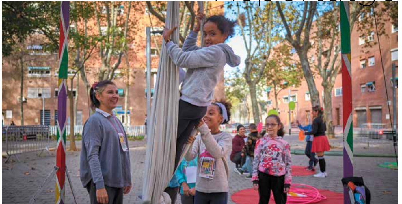
La canalla de l'Imagina't durant la Festa dels Drets dels Infants a la plaça Falset.

A nivell d'ordenació general cal destacar que s'han aprovat els plans dels Sectors 2 i 9 i s'està treballant en el Sector 6.