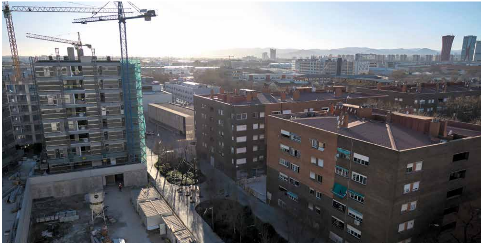
Vista del conjunt d'habitatges d'Eduard Aunós i dels blocs nous al Prat Vermell.