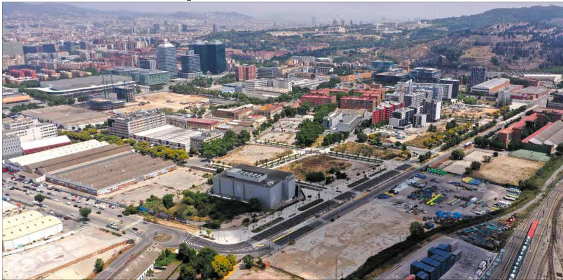
Vista aèria de la zona urbana en desenvolupament al Prat Vermell i del conjunt de barris de la Marina, Fira de Barcelona i Montjuïc.