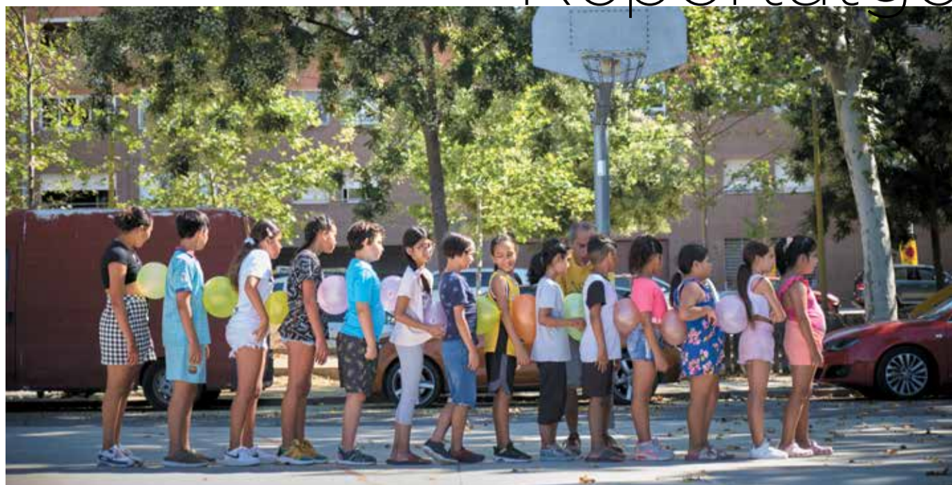
Infants jugant a l'aire lliure en una de les activitats proposades pel Servei de Dinamització Infantil i d'Adolescents Imagina't.

A més a més d'aquests centres, també hi ha la previsió de reforçar l'educació superior. El desenvolupament previst a la Marina, a més de mantenir les instal·lacions de l'Institut la Mercè , centre de formació professional de referència a Barcelona, preveu un espai al costat on està previst que la Fundació Pere Tarrés hi instal·li la seva seu que inclou una facultat universitària .