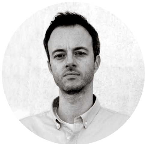
César Vivas Vivas Arquitectes