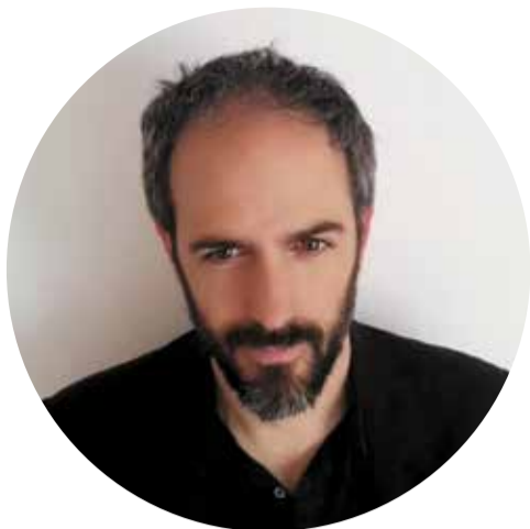
Pau Vidal Arquitecte