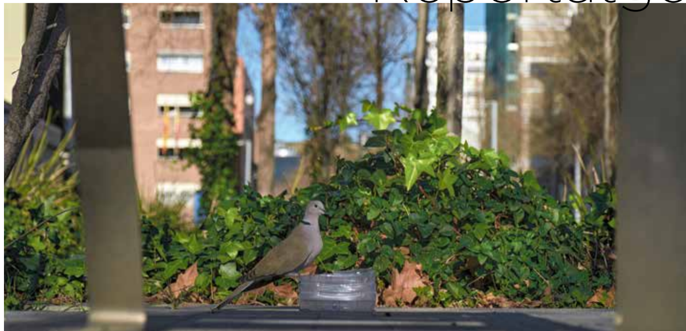
Una tórtora es refresca amb l'aigua d'un recipient, aprofitant les jardineres centrals del carrer Ulldecona.

"Els carrers tenen la mateixa amplada que els de l'Eixample, però la diferència és el repartiment de l'espai: aquí la majoria està destinat al vianant i a les jardineres, no als cotxes", segueix l'arquitecte Lamich.