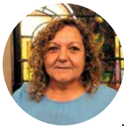
Esther Pérez Sorribas, Consellera de Barcelona en Comú al districte de Sants-Montjuïc

El Prat Vermell és un barri en plena transformació urbana, un procés que continuarà durant tota aquesta dècada en què s'intervé l'entorn amb el criteri d'augmentar el verd, la permeabilitat i la sostenibilitat a la ciutat. Es preveu que, gradualment, s'aixequin uns 12 mil nous habitatges, prop de la meitat amb algun tipus de protecció (lloguer social, dret de superfície, dotacional...), per acollir uns 28 mil nous veïns i veïnes, l'equivalent a poblacions com les de Sitges o Martorell.