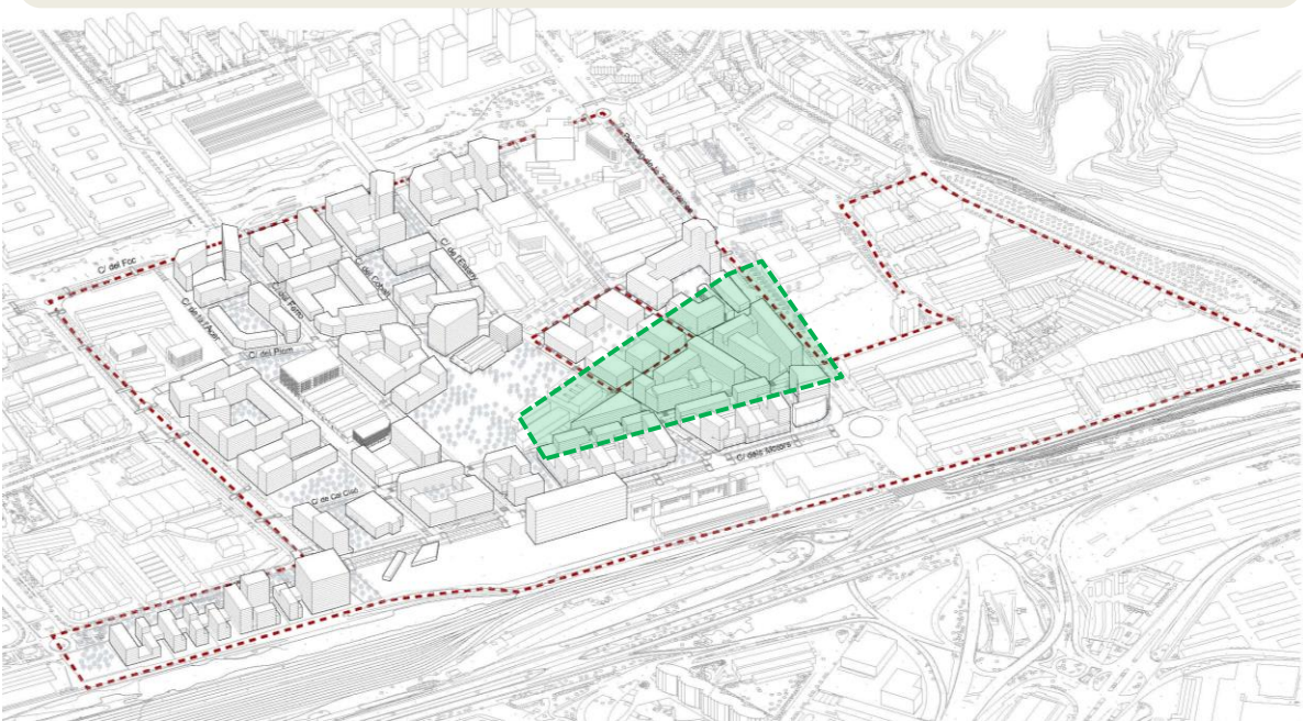
Vista aèria del Sector 10