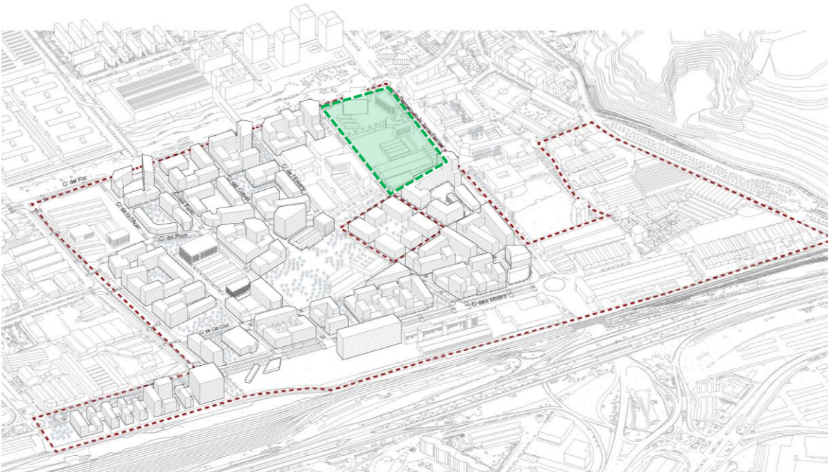
Vista aèria del Sector 5