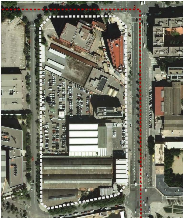
FOTOPLÀNOL, VOL. 2015