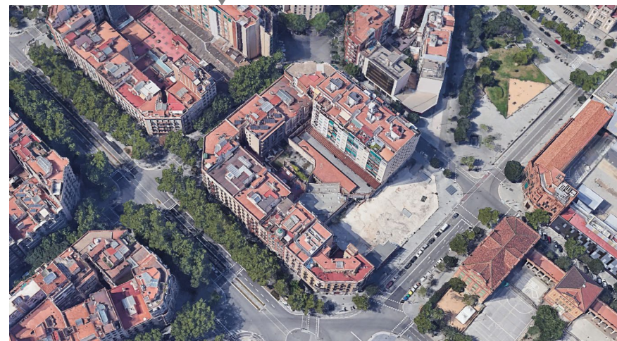
Àmbit de modificació de PGM any 2003