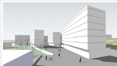
VISTA DE LA PLATAFORMA DE CONNEIXO (C)