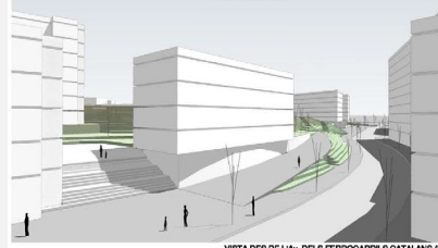
VISTA DES DE L'AV. DELS FERROCARRILS CATALANS (B)