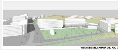
VISTA DES DEL CARRER DEL FOC (A)