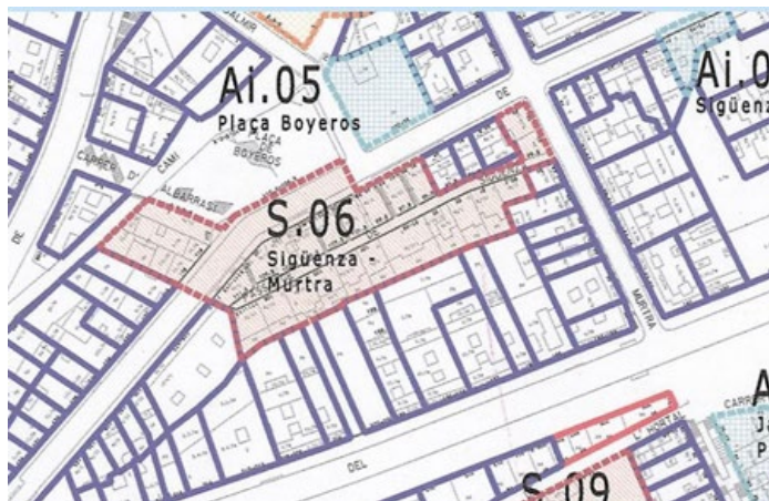
Enderrocs del ptge. Sigüenza, números 93, 95 i 97-99