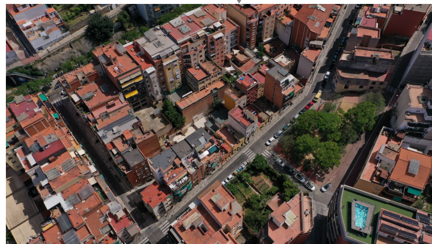
Modificació de PGM