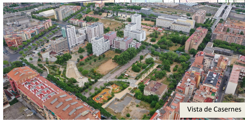
Vista de Casernes