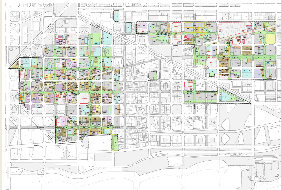
Àmbit de la MPGM 22@