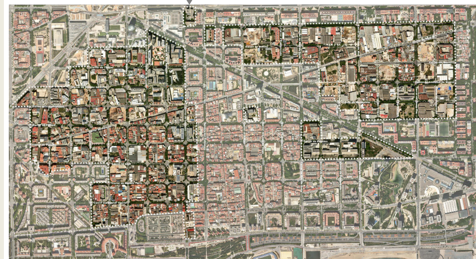
Ortofoto Districte 22@BCN