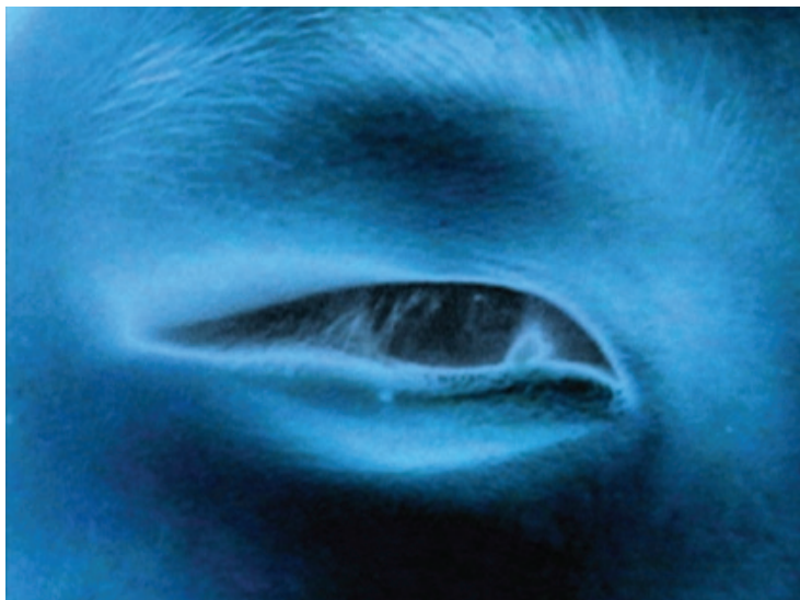
Sept visions fugitives (video, 1995) © Robert Cahen