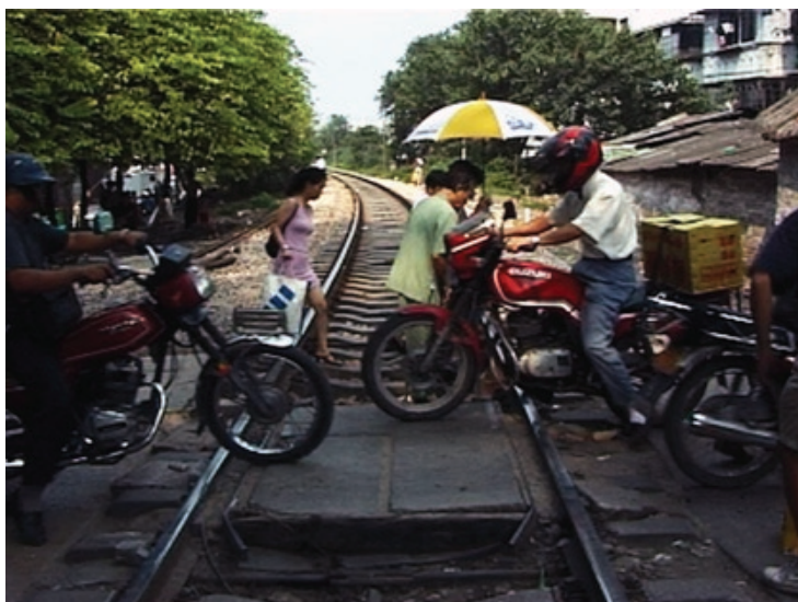
La Traversée du rail (instal·lació, 2014). © Robert Cahen