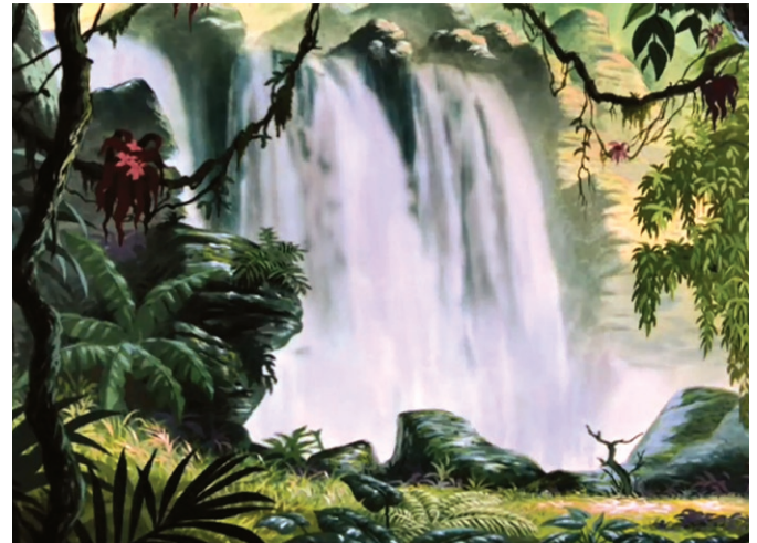
María Cañas La mano que trina , 2015 Fuera de serie , 2012