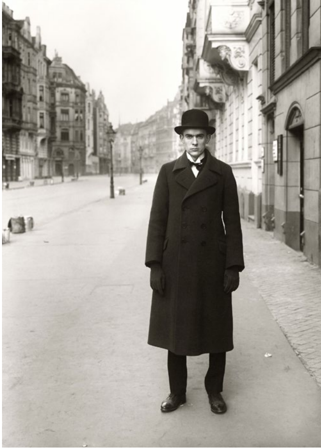
Pintor [Anton Räderscheidt], 1926