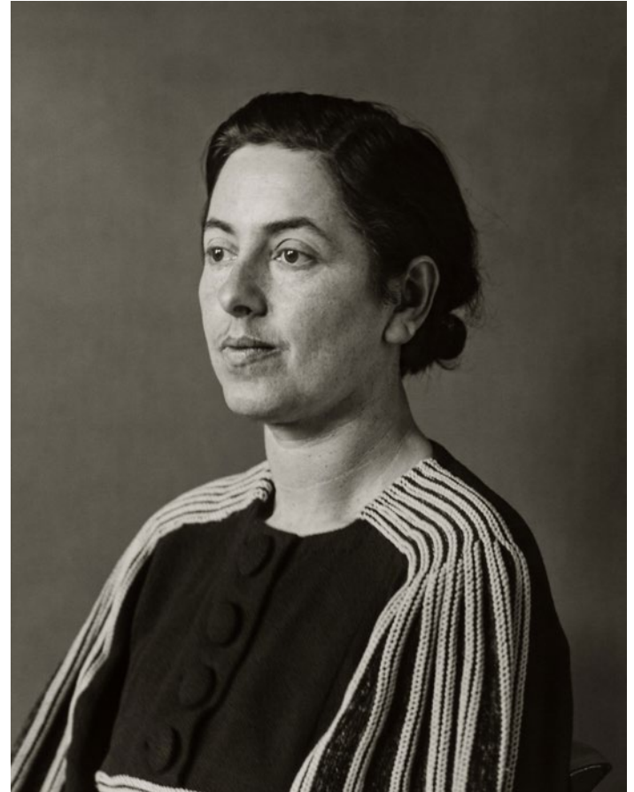
Víctima de persecució , c. 1938

A partir d'aquest breu període d'intensa activitat pública, augmenta l'atenció d'intel·lectuals i escriptors per Gent del segle XX , mentre el projecte creix d'acord amb el plaçat. L'any 1931 Walter Benjamin li dedica paraules elogioses a la seva cèlebre Kleine Geschichte der Photographie [Petita història de la fotografia]. De la mateixa manera, el mateix any, Sander imparteix un