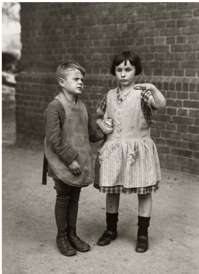
Infants cecs de naixença, 1921-1930