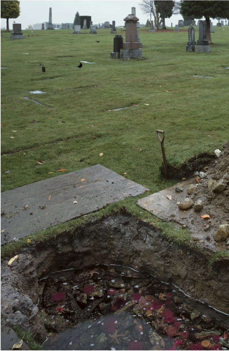
The Flooded Grave (detall), 1998-2000. Transparència sobre caixa de llum. © Jeff Wall.