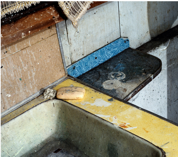
Diagonal Composition , 1993. Transparència sobre caixa de llum, 40 x 46 cm. © Jeff Wall.