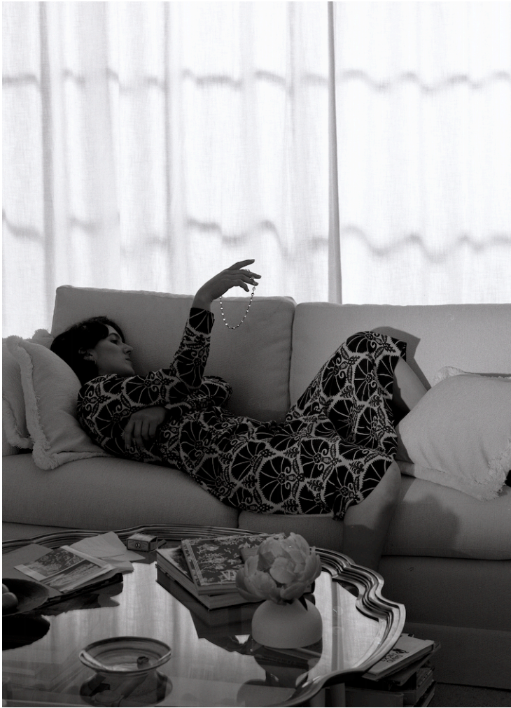
A Woman with a necklace (detail), 2021. Impressió en gelatina de plata. © Jeff Wall.