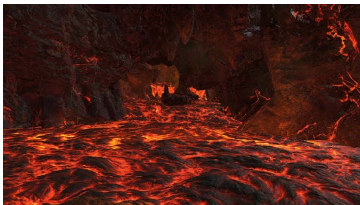
Raisa Maudit, 2024