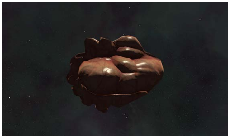
Raisa Maudit, 2024