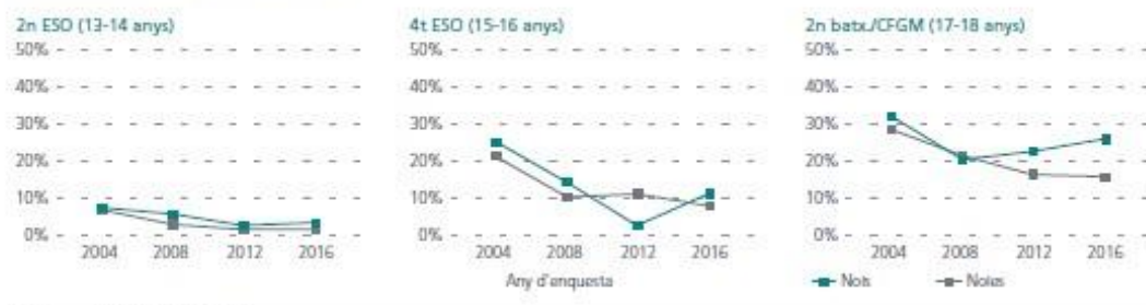
Figura 11. Percentatge de l'alumnat adolescent de Barcelona que ha consumit cànnabis en els últims 30 dies, segons sexe i curs. Barcelona, 2004-2016.

darrer període en els cursos 4t d'ESO (edats de 15 a 16 anys) i 2n de batxillerat i cicles formatius de grau mitjà (edats de 17 a 18 anys). En el cas de l'evolució en el consum de cànnabis alguna vegada a la vida (considerat com un consum experimental), també presenta un descens sobretot en els cursos de l'ESO (edats de 13 a 16 anys). En canvi, en el darrer període entre els adolescents de 2n de batxillerat i cicles formatius de grau mitjà (edats de 17 a 18 anys) s'observa un repunt d'aquest tipus de consum en tots dos sexes.