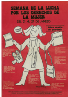
Cartell de la Coordinadora de Vocalies de Dones de les Associacions de Veïns de Nou Barris, (sense data). Il·lustració de Núria Pompeia. CLD