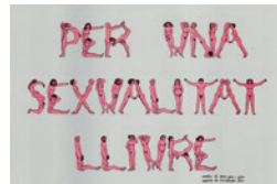
Cartell d'un acte del 8 de març (sense data). CLD