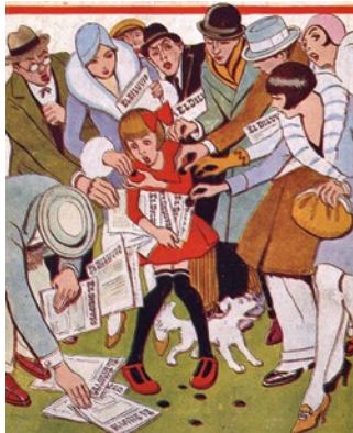
Dibuix de l'Opisso, de l'almanac de 1930 d' El Diluvió

Accés amb mobilitat reduïda previ avís a: palaudelaprensa@gmail.com