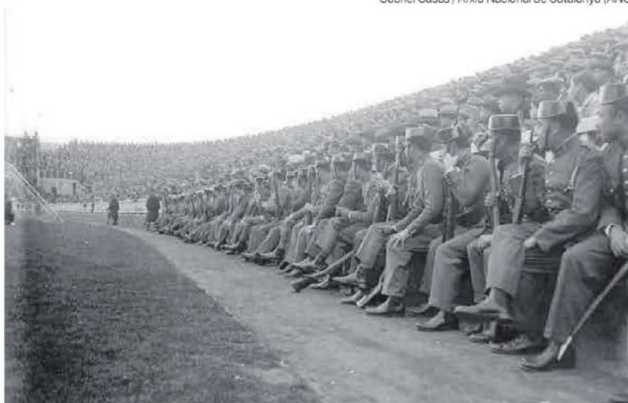
Membres de la Guàrdia Civil al camp de les Corts, durant un partit entre el Barça i l'Espanyol, el 1925.

El circuit inaugurat el 1923 i amb l'etiqueta de ser el tercer permanent d'Europa després de Brooklands (Anglaterra) i Monza (Itàlia) no és l'única arquitectura captada per les càmeres de Casas que ja no existeix: a les parets del Palau Robert també hi ha imatges de Maricel Park, el parc d'atraccions de vida efímera que va ocupar Montjuïc després de l'Exposició Internacional del 1929 i del Principal Palace amb Josephine Baker a l'escenari. I així fins a cent instantànies d'un món i una ciutat que ja no existeixen, però que es conserven en el llegat de Casas. ■