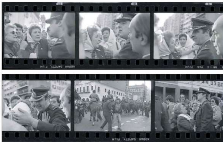
Tira de negativos originales del momento en que ocurrió la escena.