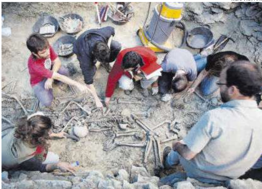
Treballs d'exhumació a la fossa de Gurb, a Barcelona, el 2008.

No és nou que des de la política s'intenti gestionar la memòria aliena, imposar la desmemòria amb mala intenció i per pura vagància, ja que resulta més fàcil governar la tabula rasa . El cap del proïsme com un solar gegant buit, un disc dur que poden esborrar a voluntat o omplir amb tonteries. Davant el dret a conèixer la veritat, alguns hi oposen l'obligació d'oblidar. El problema rau en el fet que exigeixen la desaparició de records cada vegada més recents. S'ha de canviar de pantalla, que es diu ara, a velocitats de vertigen, independentment de la importància de la informació o els sentiments emmagatzemats. Es busquen ciutadans semblants al peix Dory, l'amiga de Nemo que oblidava el que acabava de dir o fer minuts abans. Governen aquest país personatges com el vicepresident de Madrid, del PP, Enrique Ossorio, que va assegurar la setmana passada que les famílies dels 5.000 usuaris de residències per a la tercera edat de la seva comunitat morts en la primera onada de la pandèmia «ja han girat full». És el seu argument per no investigar la mala o nul·la atenció que se'ls va