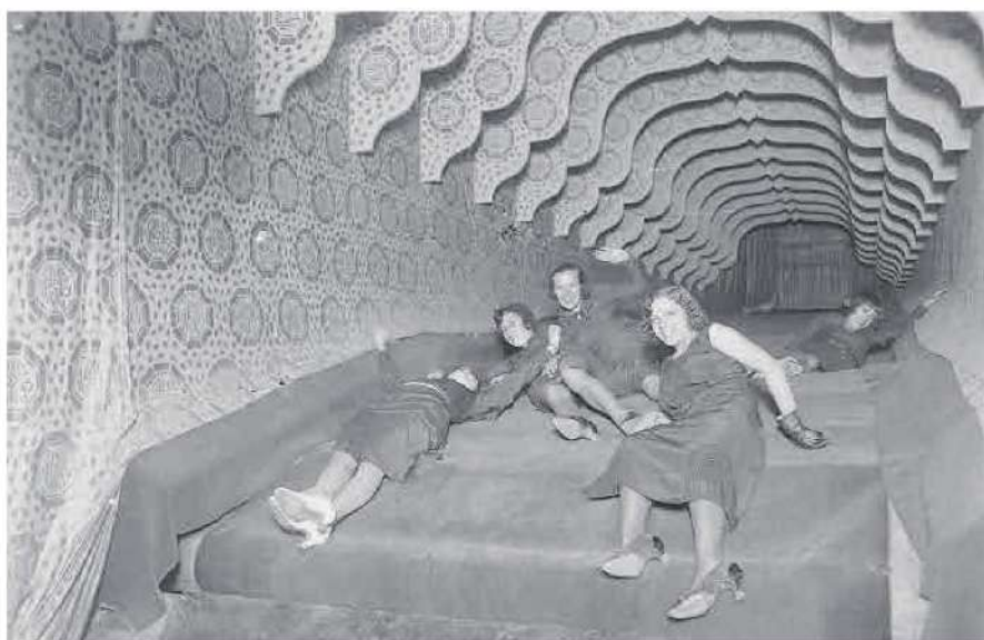
Cinc models al tobogan del parc d'atraccions Maricel Park de Montjuïc, el 1930.