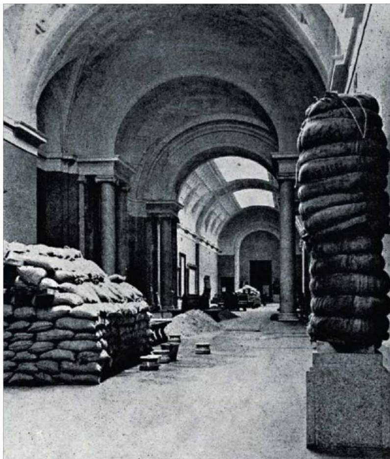
Estado del Museo del Prado en 1937.

Acabada la guerra, los franquistas crearon el infradotado económicamente Servicio de Defensa del Patrimonio Artístico Nacional (SDPAN) —en los primeros años sus componentes ni cobraban— para devolver a sus auténticos propietarios las obras de arte que habían podido recuperar en los lugares donde los republicanos las habían guardado. El resultado final fue que de las 17.000 incautadas durante la Guerra Civil, 8.710 siguen desaparecidas o se ignora el nombre de sus dueños. Falsos aristócratas, dirigentes del régimen y aprovechados de todo tipo aseguraron ser dueños de piezas que no les pertenecían y arramblaron con cuadros, joyas, esculturas o tapices que eran propiedad de personas que habían muerto en la guerra o huido al exilio. A veces se detectaba el engaño y se paraba, otras se miraba para otra parte.