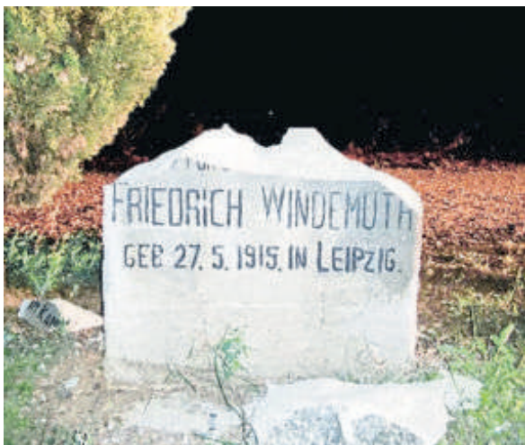
DAVID GARCIA ALGILAGA

Aquesta estela funerària ja havia estat objecte abans de pinta-