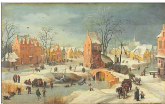
Desde la izquierda, Paisaje nevado , de Jan Brueghel el Joven, y Amorcillos vendimiando , de François Boucher, dos de las obras certificadas por el Museo del Prado incautadas en la Guerra Civil.