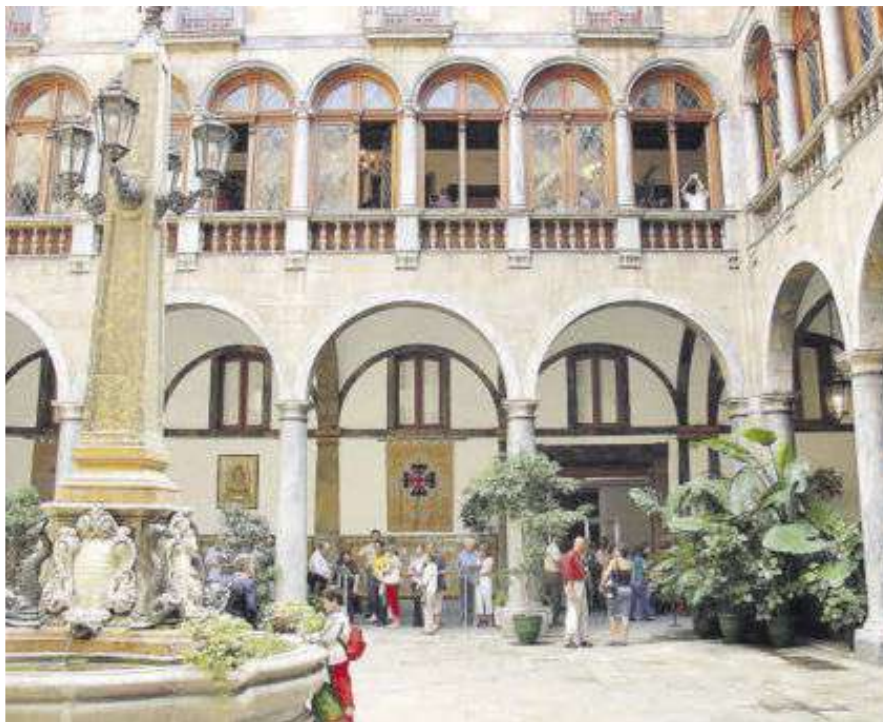
L'edifici de la Capitania General de Barcelona durant una jornada de portes obertes.

En aquell moment, Barcelona estava ficada en un procés de transformació similar al que va viure abans dels Jocs Olímpics del 1992, i la ciutat volia ensenyar la seva millor cara als visitants. La