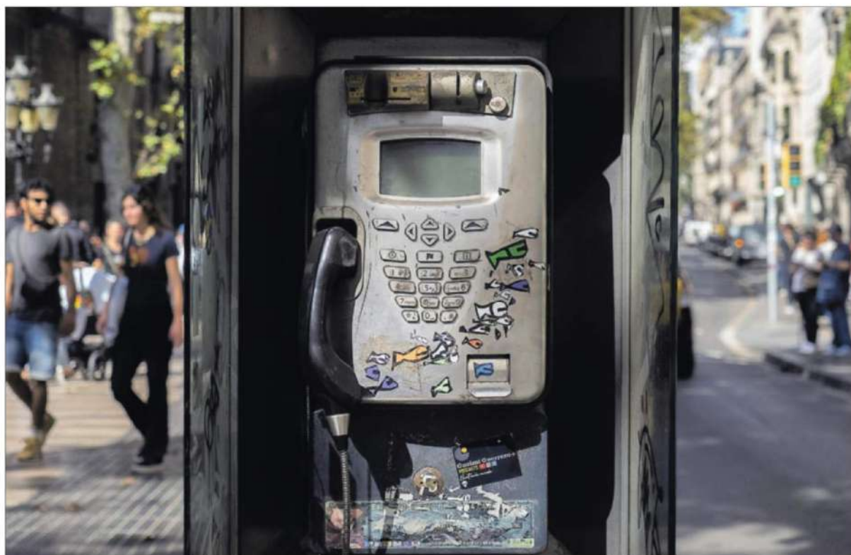
Una de las cabinas telefónicas que siguen en pie en La Rambla, sin funcionar, el miércoles.

En la ciudad quedan 457 teléfonos públicos, la mayoría estropeados. Telefónica los lleva al desguace porque desde enero ya no está obligada a prestar el servicio