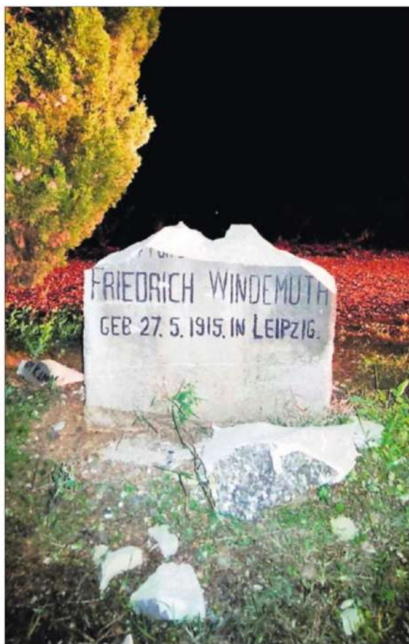
El monumento al piloto alemán, tras el acto vandálico.

Valldeperes, que recuerda que el monumento ya sufrió otro ataque vandálico en 2009, lo que molestó sobremanera a Falcó, especula con que el o los atacantes deben considerar que la estela es un homenaje a un fascista y, por lo tanto, objetivo legítimo. "Pero es un ataque a