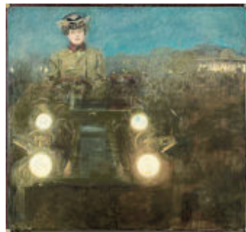
RAMÓN CASAS I CARBÓ / CERCLE DEL LICEU

Entre els nuclis d'estructuració definidors de la modernitat en alça, insistiríem postimpressionista, es perfila una Europa de les ciutats que rescata potser la vella energia tardorenaiixentista, però amb projectes de reconstrucció