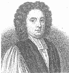
Trinity College Dublin has decided to rename its central library, right. The philosopher George Berkeley, above, after whom it was named, owned slaves and wrote pamphlets in support of slavery.

In Ireland, Trinity's formal re-examination of Berkeley's legacy began last year after students at the college started