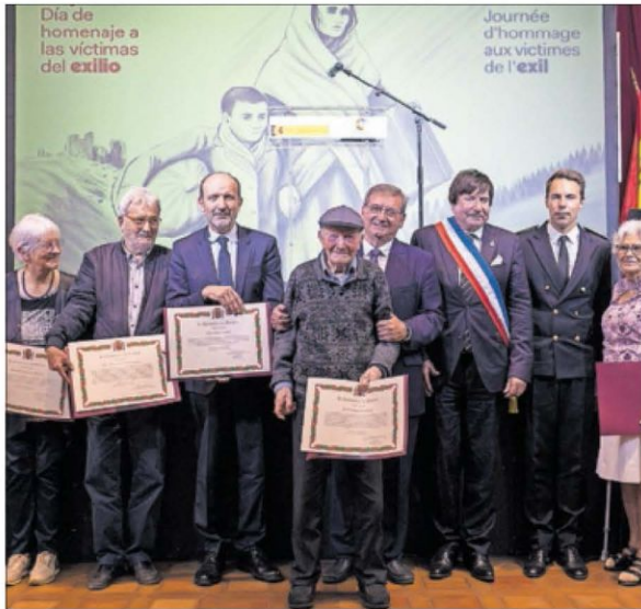
Representantes del exilio y la resistencia republicana, junto a las autoridades españolas y francesas ayer Colliure (Francia).