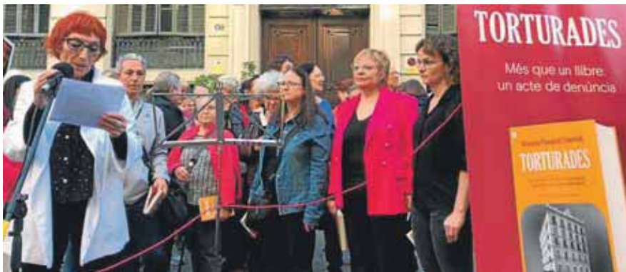
Una de les protestes recents , en aquest cas de dones que van ser torturades a la prefectura de Via Laietana els casos de les quals van ser recollits en un llibre

El Ministeri de la Presidència ha acceptat a tràmit la petició presentada per l'Ateneu de Memòria Popular per tal que l'edifici de la prefectura superior de la policia espanyola, al número 43 de la Via Laietana de Barcelona, sigui declarat espai de memòria. L'Ateneu va presentar la sol·licitud d'incoació del corresponent procediment administratiu al gener davant la direcció general de Memòria Democràtica –que depèn de la secretaria d'estat del mateix nom–, basant-se en els articles de la llei de memòria democràtica aprovada l'any passat que