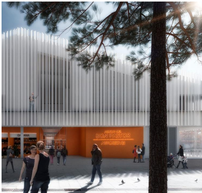
Imatge virtual parcial de la façana del carrer Sant Adrià

L'edifici compta amb 9.340 metres quadrats distribuïts en planta baixa, altell i dos plantes soterrani