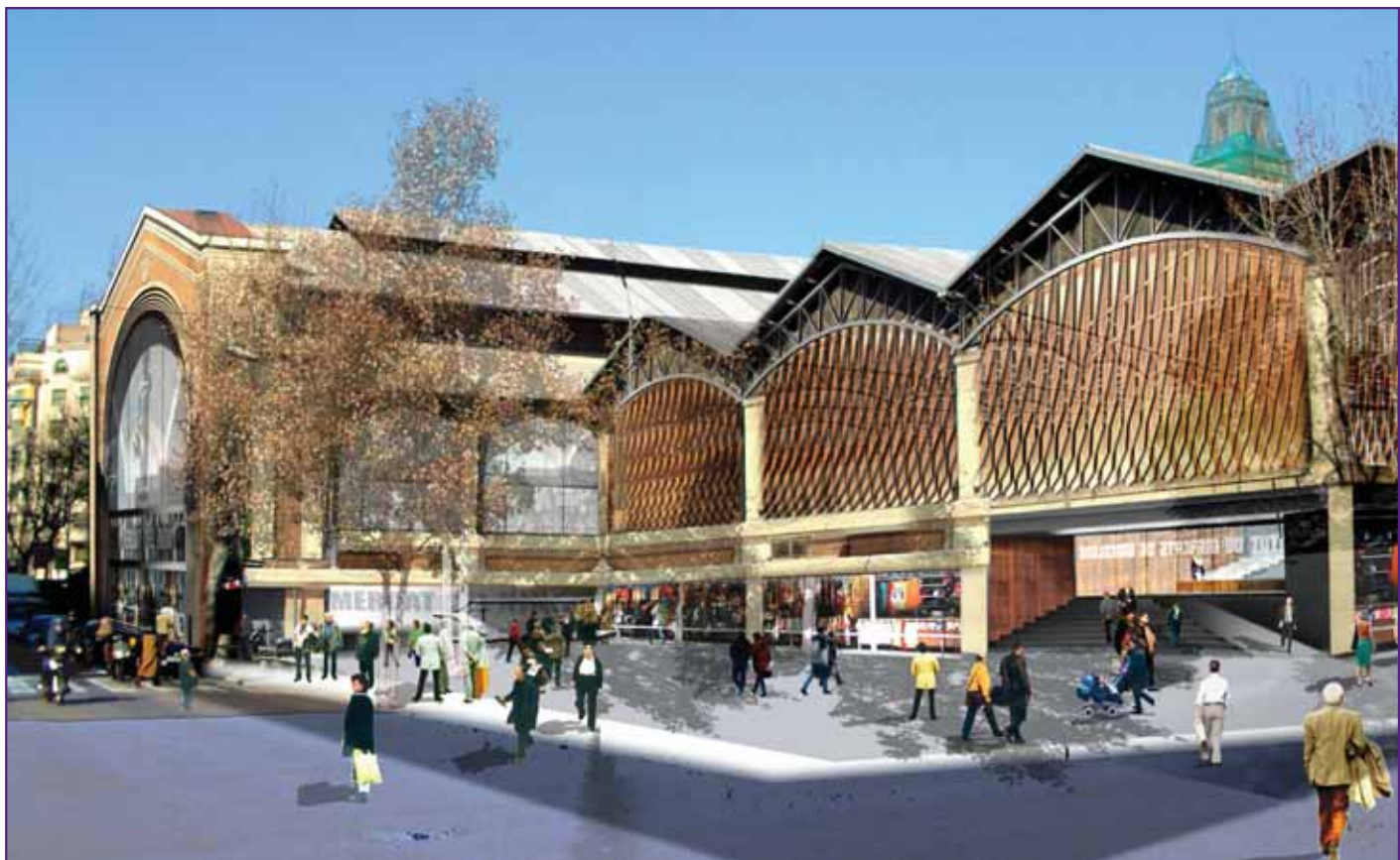
Disseny pel futur Mercat del Ninot

Les obres començaran el 2008 i mentre aquestes durin els comerciants es traslladaran a mercats provisionals instal·lats prop dels actuals emplaçaments, sempre mantenint íntegra l'oferta comercial. ■