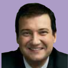
Jordi Hereu Alcalde de Barcelona

Els mercats són espais oberts, de diàleg i relació que ajuden a cohesionar els nostres barris. I són també estructures importants en la vida econòmica de la ciutat. Des dels anys 90, l'Ajuntament ha iniciat un ambiciós pla de modernització i remodelació dels mercats. Estem convençuts que modernitzar els mercats és modernitzar la ciutat i fer de Barcelona un lloc encara millor per viure-hi.