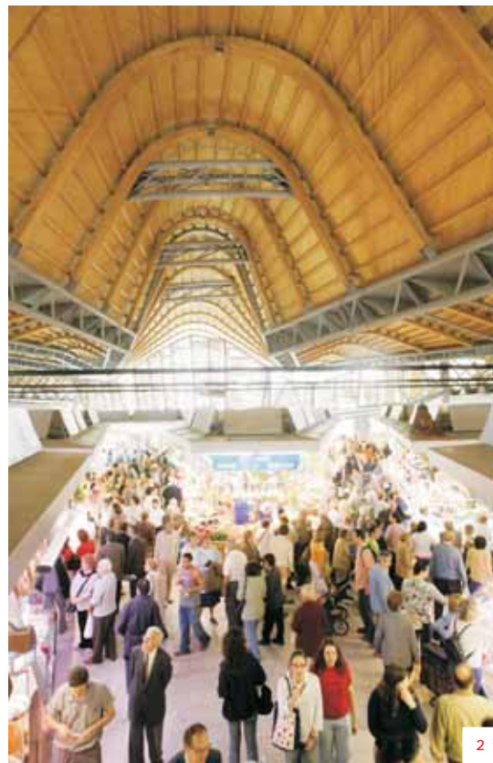
1. El projecte arquitectònic conserva una part de la façana antiga. La nova coberta, però, hi dona un toc molt modern. 2. La coberta interior és de fusta, i dona molta calidesa.