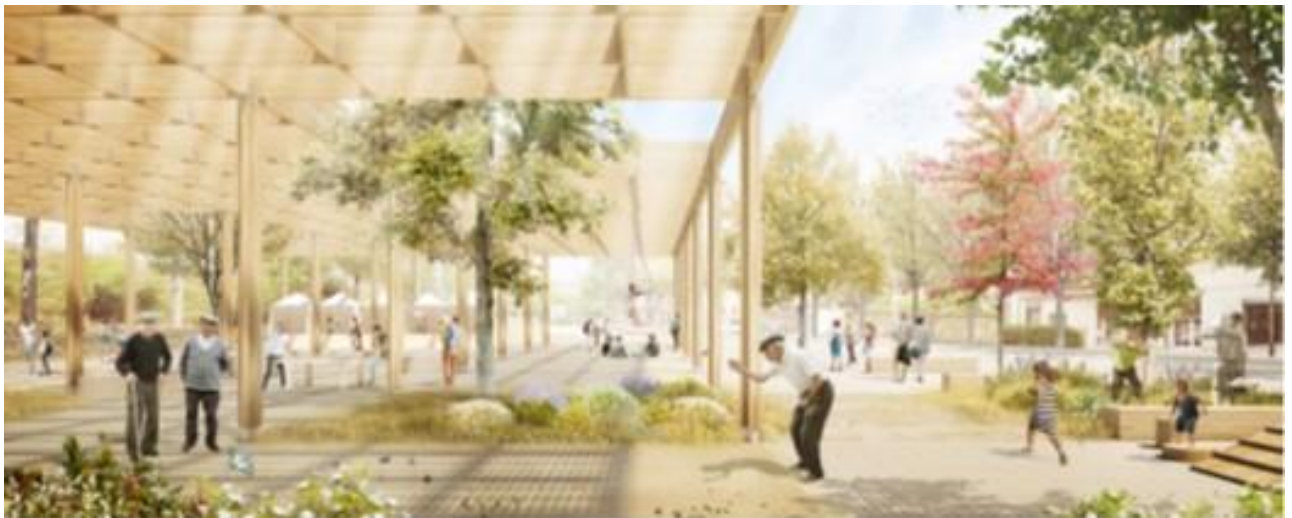
Estructura reutilitzada en el futur parc

La voluntat és que el Mercat d'Horta estigui en marxa provisionalment en aquest emplaçament fins a l'estiu de 2023.