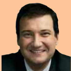
Jordi Hereu Alcalde de Barcelona

El mercat de Sarrià necessitava posar-se al dia. Per això l'Ajuntament, per mitjà de Mercats de Barcelona, ha invertit diners i esforços per tal que, juntament amb els comerciants pugui des d'ara gaudir de millors serveis. La modernització incorpora modernes càmeres frigorífiques i magatzems, un aparcament per als clients, noves instal·lacions logístiques i una xarxa d'enllumenat nova. També s'ha adaptat per a les persones amb mobilitat reduïda. Les botigues són ara més grans, més lluminoses i funcionals. El nou mercat manté el millor de la seva tradició (producte fresc excel·lent i acurada atenció personal) i incorpora tot allò que cal al segle XXI per seguir sent un establiment líder.