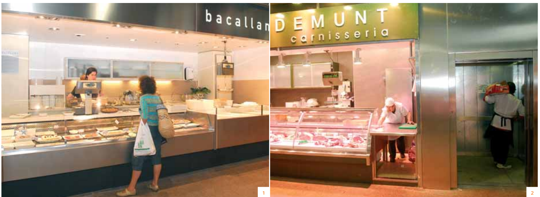
1, 2 i 5 Imatge de les noves parades, totalment modernitzades. 3 La nova porta principal ha facilitat l'accessibilitat al mercat. 4 La sala de vendes té més lluminositat.

L'empresa constructora G56, la mateixa que va reformar integralment el Mercat de Poble Nou, és la que s'ha encarregat de la remodelació. L'arquitecta que firma el projecte és Àgata Vila. ■