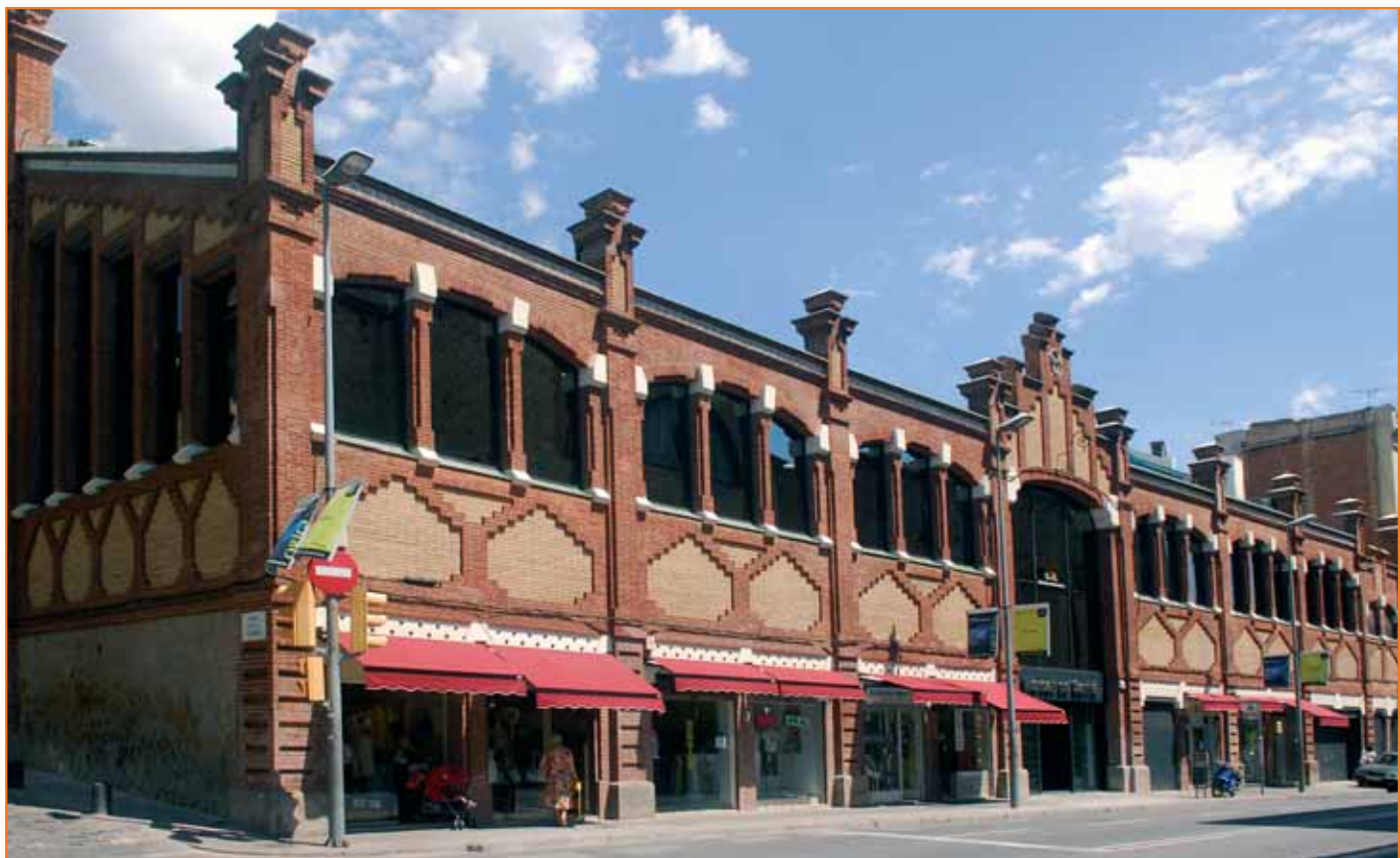
Imatge de la façana del nou mercat de Sarrià.

La rehabilitació s'ha realitzat en un temps rècord de menys d'un any i ha permès crear un espai més agradable i confortable a la sala de vendes, amb botigues noves, nous magatzems i càmeres frigorífiques i un nou aparcament. També s'han adaptat els accessos per a persones amb mobilitat reduïda i construït un nou vestíbul. S'ha rehabilitat la façana, exponent del modernisme català i s'han instal·lat nous sistemes elèctrics i d'enllumenat. ■