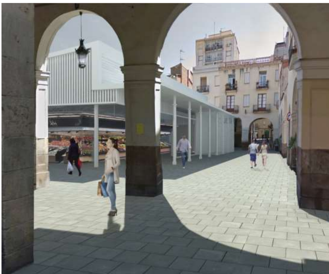
Imatge virtual de la futura plaça Mercadal i el mercat.