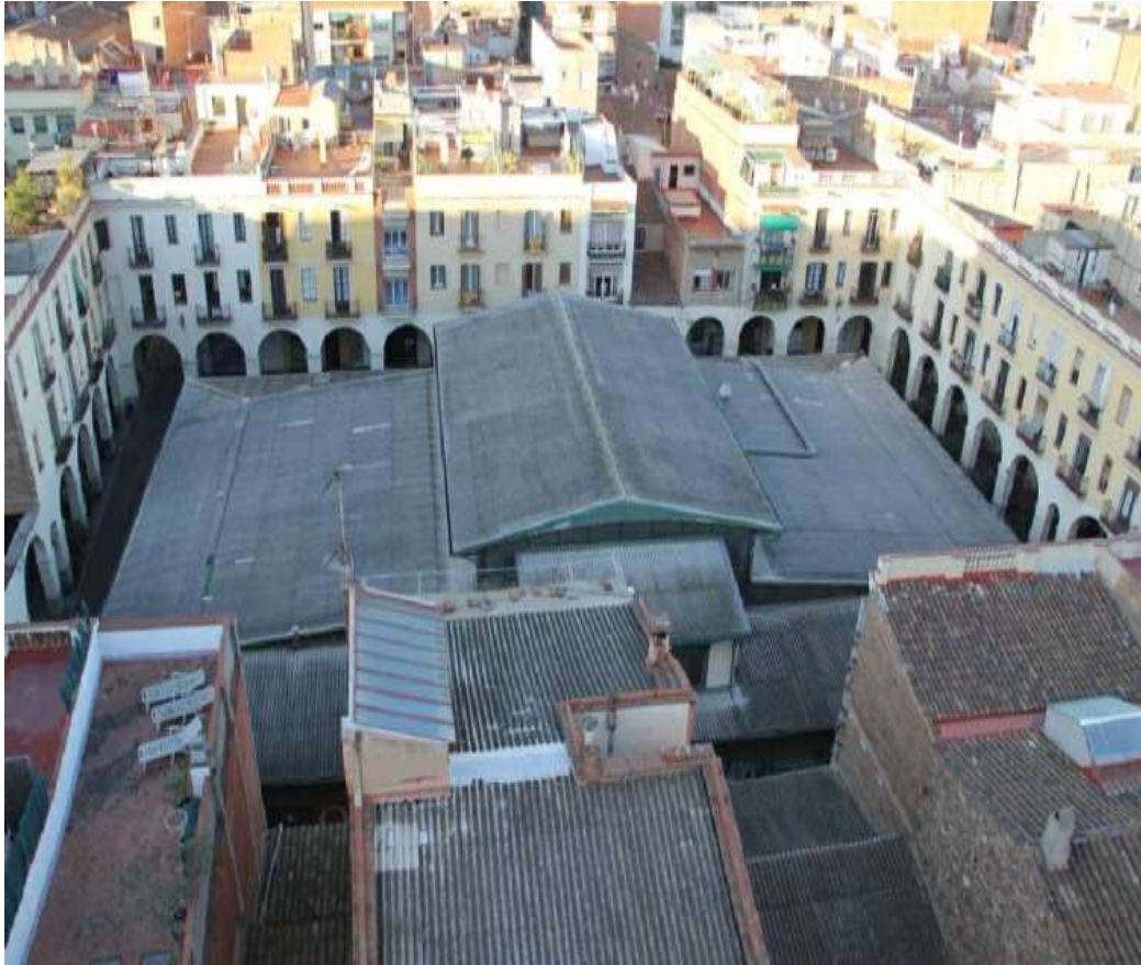
Vista actual de la coberta del mercat de Sant Andreu

Els comerciants celebraran la inauguració del mercat provisional, amb els clients i veïns del barri, amb una festa popular el dissabte 11 de novembre al matí. Hi hauran tallers infantils, música, dinamització i castellers.