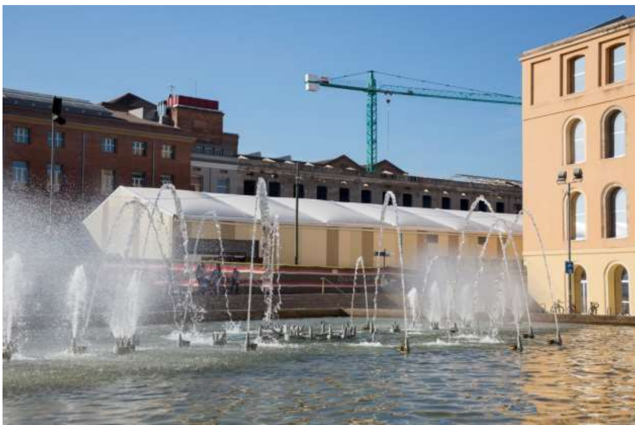
Imatge actual del mercat provisional