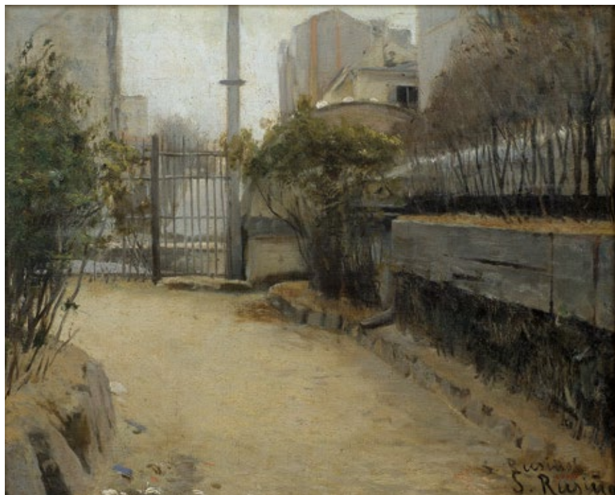
Figura 16. Pintura. Santiago Rusiñol, Jardí de Montmatre , París, 1890-1891, oli sobre tela. MNAC 40.095