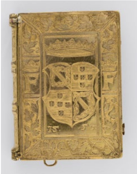
Figura 10. Rellotge de penjar. Europa, 1550. Acer i aliatge de coure gravat. MADB 38.850 Museu del Disseny de Barcelona