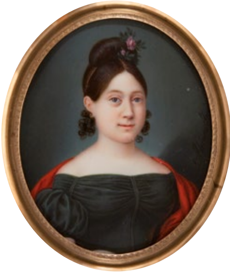
Figura 14. Miniatura. Adrià Ferran Andrés. Espanya. Retrat de dona , cap al 1835. Aiguada sobre ivori. MADB 39.993. Museu del Disseny de Barcelona