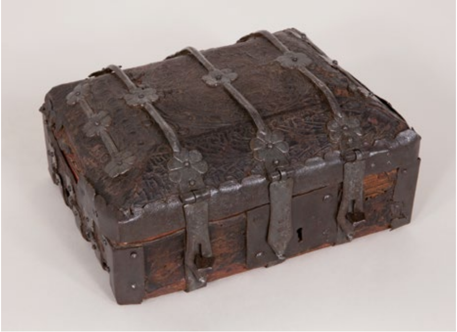
Figura 12. Arqueta. Catalunya, 1350-1450. Fusta recoberta de cordovà gravat. Ferro forjat i cisellat. MADB 37.973. Museu del Disseny de Barcelona