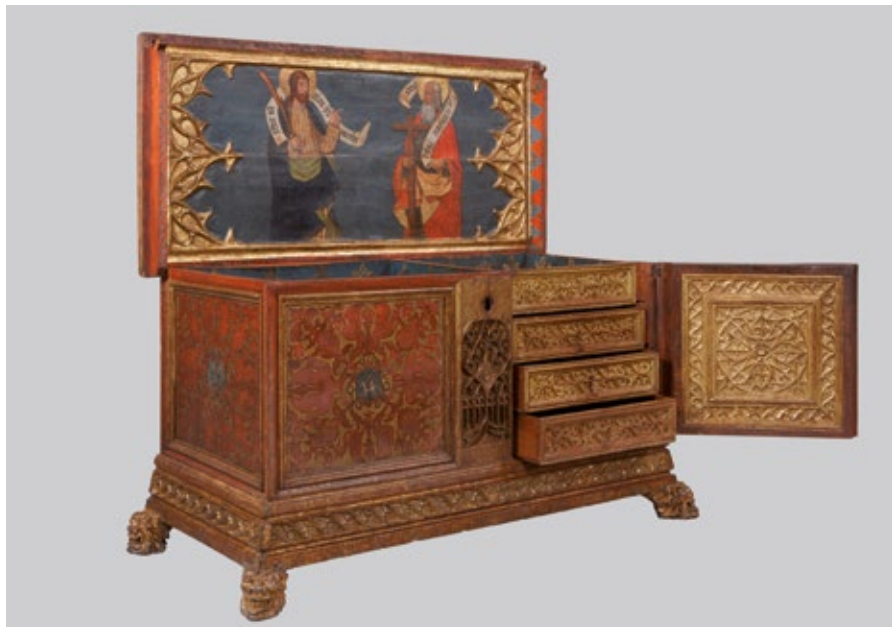
Figura 18. Caixa amb calaixos. Catalunya, darrer quart del segle xv. Fusta tallada i policromada. MADB 40.103. Museu del Disseny de Barcelona