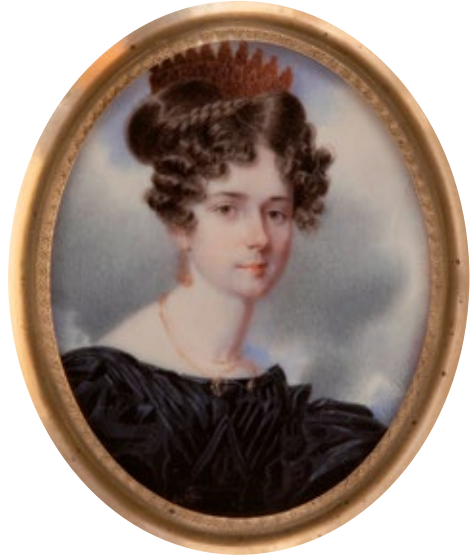
Figura 15. Miniatura. Hugh Bridport. Filadèlfia. Retrat de dona , cap al 1830. Aiguada sobre ivori. MADB 40.010. Museu del Disseny de Barcelona

D'entre les pintures que posseïa Martí Estany, només un exemplar estava específicament assignat en el llegat. Es tractava d'una obra del pintor valencià Vicente López Portaña (1772-1850), Retrat del gravador Pasqual Pere Moles , primer director de l'escola de Llotja de Barcelona, datat entorn del 1794.