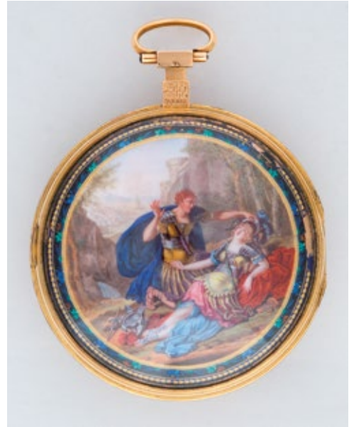
Figura 11. Rellotge de penjar. Ginebra, 1780-1820. Aliatge de coure decorat a l'esmalt amb escena homèrica. MADB 38.707. Museu del Disseny de Barcelona