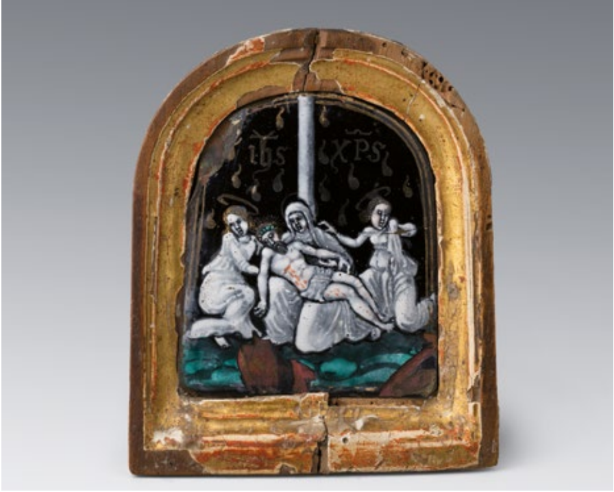
Figura 17. Portapau. Placa d'esmalt de Llemotges. La Pietat , segle XVI. MADB 40.086. Museu del Disseny de Barcelona

al segle XVI i l'únic del conjunt integrat actualment al Museu del Disseny de Barcelona (fig. 17).