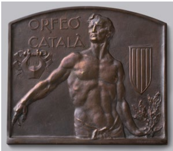
Figura 7. Placa de bronze modelada per Dionís Renart i lliurada a Martí Estany la nit de l'1 de febrer de 1934 al Palau de la Música Catalana