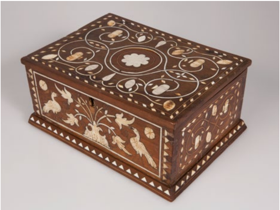
Figura 13. Arqueta. Aragó, segle xvi. Fusta i ós gravat. MADB 39.982. Museu del Disseny de Barcelona