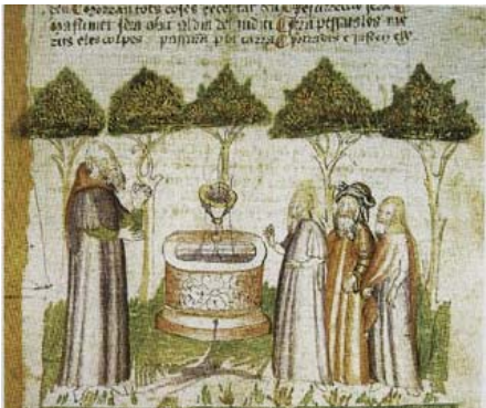
Representació d'un jueu, un cristià i un musulmà parlant amb un gentil. Segona meitat del segle XIV. Mallorca. Biblioteca Pública de Palma de Mallorca.