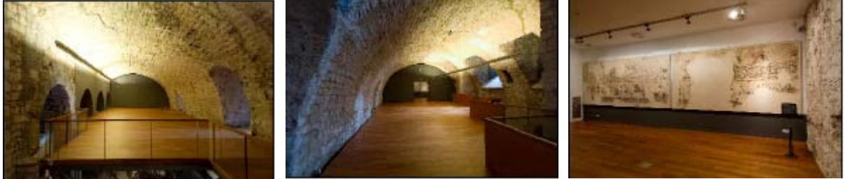
Sales anomenades de les voltes romàniques

La col·lecció, al voltant de les 200 peces , la major part procedents d'excavacions dutes a terme a la ciutat, en la majoria dels casos inèdites i que mai fins ara no s'havien exposat, enllacen amb el discurs històric que s'explica als 4.000 m2 del subsòl arqueològic del s.I a.C fins al s.VIII, on es troben les restes de la colònia romana i del conjunt episcopal de Barcino.