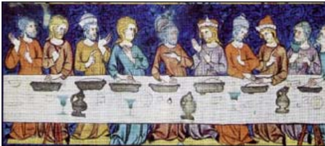
Taula parada on hi ha els talladors per compartir, els pitxers de metall, les copes de vidre i el pa rodó o trossejat per acompanyar la vianda, i el saler, petit recipient amb tres peus i tapadora. C. 1315. França. Bibliothèque interuniversitaire de Montpellier, section Médecine.