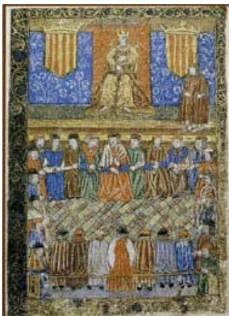
Imatge del rei Jaume I, presidint les Corts Catalanes. Sota el seu regnat la cort va començar a celebrar sessions extraordinàries amb la participació d'un major nombre de personalitats. Any 1495. Barcelona. Arxiu de la Corona d'Aragó.

Al segle XI, hi havia dotze comtats que conformaven el que avui es Catalunya. A mitjans del segle XII, Barcelona era la ciutat més important de Catalunya i el comte de Barcelona, el senyor més important. Només quedaven quatre comtats fora dels seus dominis.