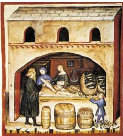
Imatge d'una peixateria. Finals del segle XIV Itàlia. Es ven peix fresc que es troba als cistells i arengades en barrils. El consum de conserva de peix sec i salat era molt comú, ja que era un producte perible. Österreichische Nationalbibliothek.

El comte tenia el dret a establir les fires i els mercats, fixar el lloc i dia de celebració i donar permís per posar-hi bancs i taules. Al principi, les parades del mercat eren mòbils, tot i que ja al segle XI és té notícia de l'existència d'estructures permanents. De mica en mica, les parades es van agrupant en funció del producte que es venia. Al mercat s'hi venien també esclaus.