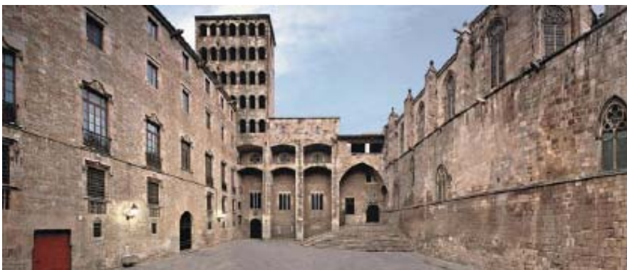
Conjunt Monumental de la Plaça del Rei (MHCB).