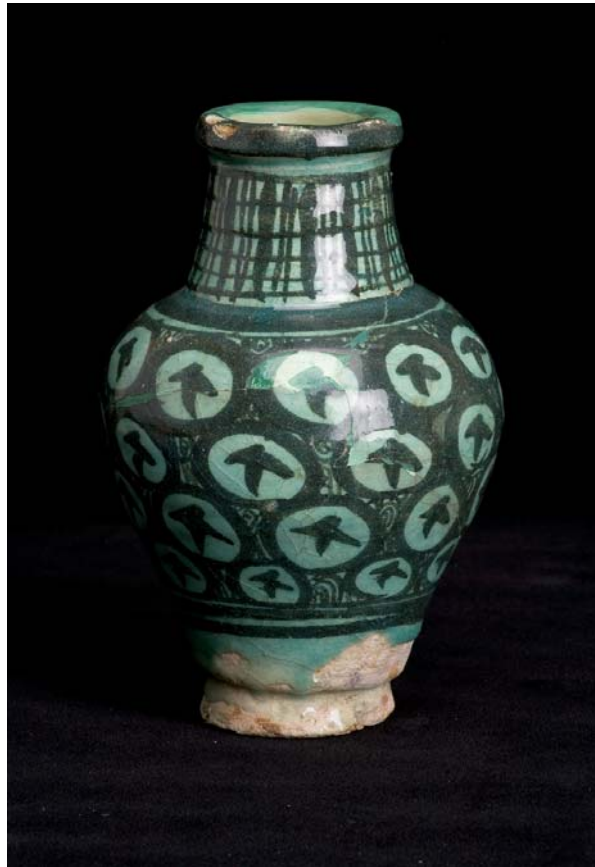
Gerra de ceràmica islàmica procedent de Raqqa (Síria)

Al llarg dels cinc segles presentats en aquestes sales del palau comtal/reial, Barcelona es consolidà com una capital mediterrània, amb una població dinàmica i unes institucions polítiques amb un projecte ambiciós: l'expansió per la Mediterrània.