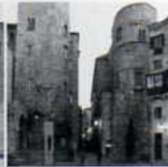
12 Plaça Nova Aqüeducte i porta de la muralla romana