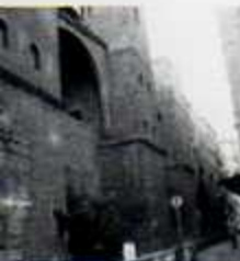
Carrer Sots-tinent Navarro Muralla romana i torres de defensa

Fora de la ciutat romana estaven situades les tombes i mausoleus, tal com podem observar a la necròpolis conservada a la plaça Vila de Madrid 10. Antigament, les necròpolis estaven situades als voltants de les vies que portaven a les portes d'entrada a la ciutat. La seva situació estava fixada per la llei romana, que prohibia enterrar els difunts al seu interior. A la plaça Vila de Madrid les tombes se situaven a ambdós costats de la via i la majoria corresponen a cupes, un tipus de monument funerari que reproduceix en pedra una tina de fusta i que és propi de gent de classe mitjana i humil.