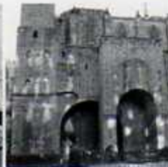
8 Plaça Ramon Berenguer Muralla romana i torres de defensa