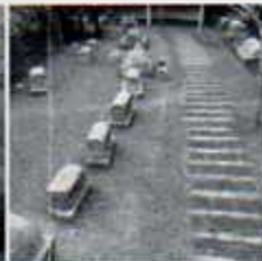
10 Plaça Vila de Madrid Via sepulcral romana