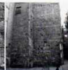
1 Plaça del Rei, MHC B Jaciment arqueològic