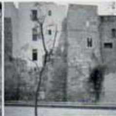
11 Carrer la Palla Muralla romana i torres de defensa