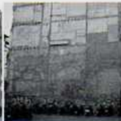
9 Carrer Duran i Bas Aqüeducte romà