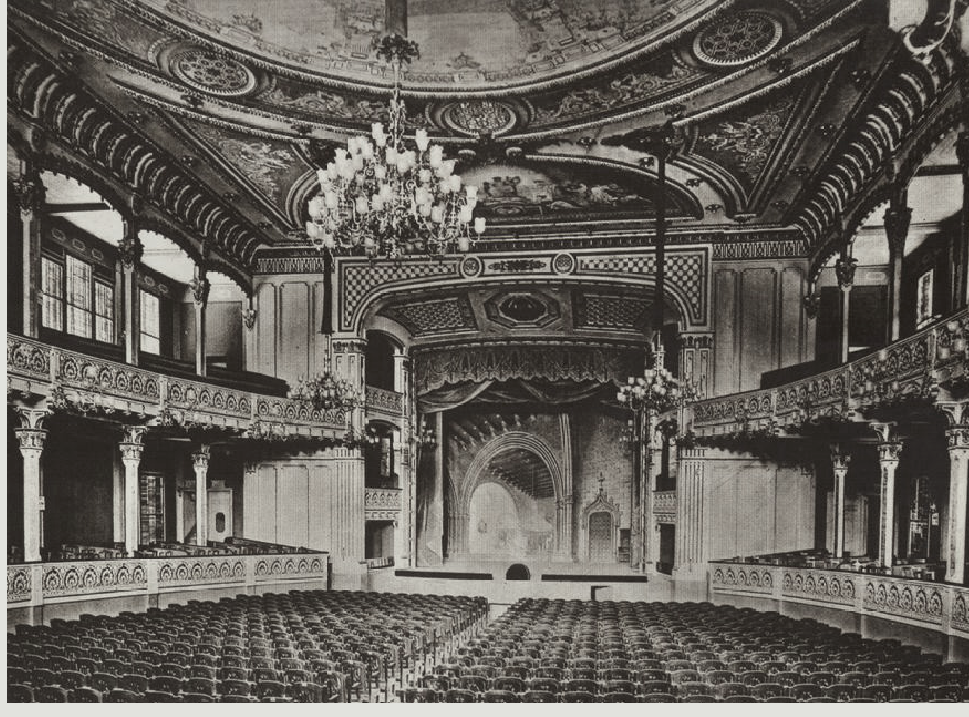
Sala Beethoven (ca. 1881).