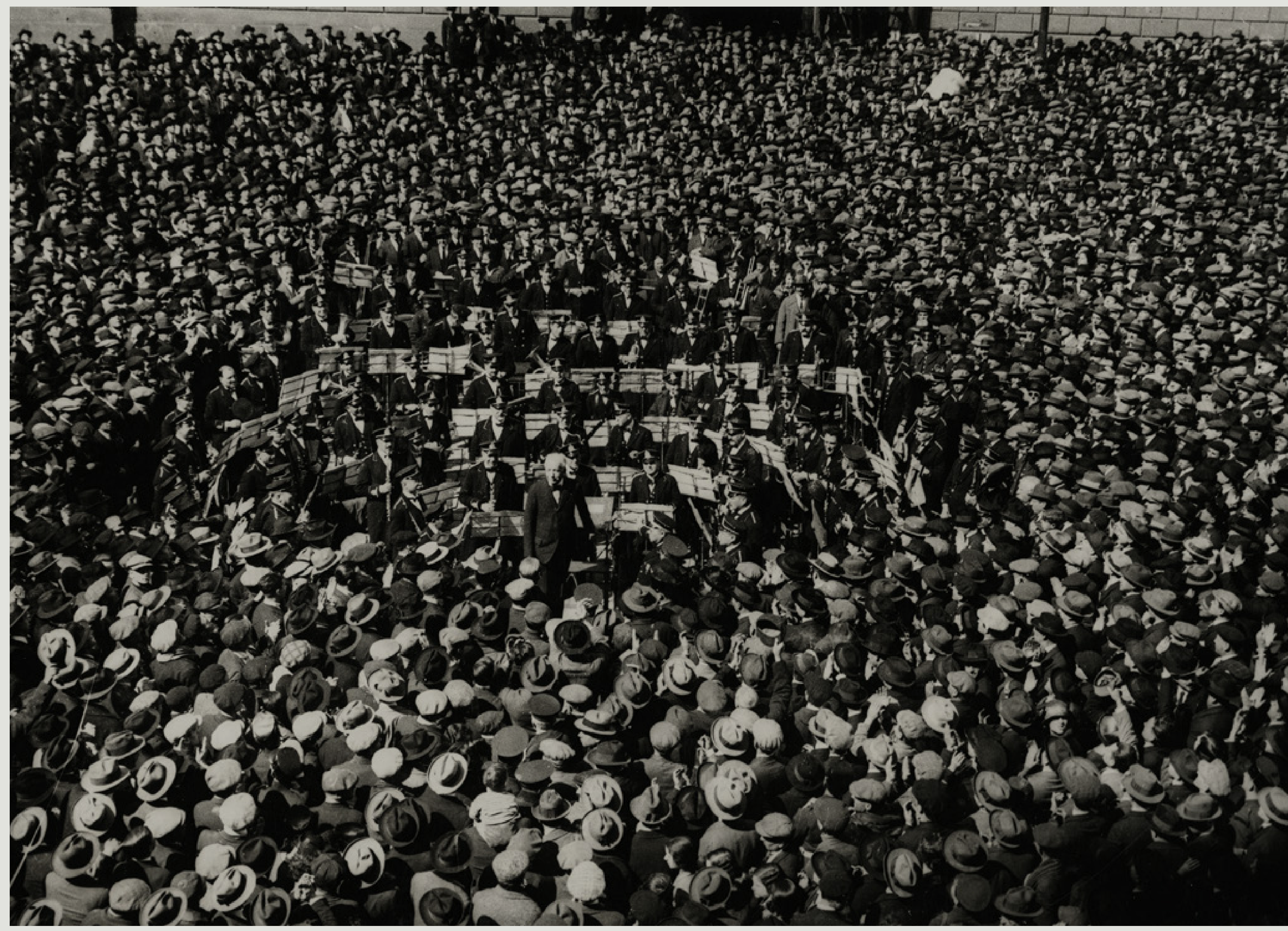
La Banda Municipal de Barcelona dirigida per Richard Strauss a la plaça Sant Jaume de Barcelona.