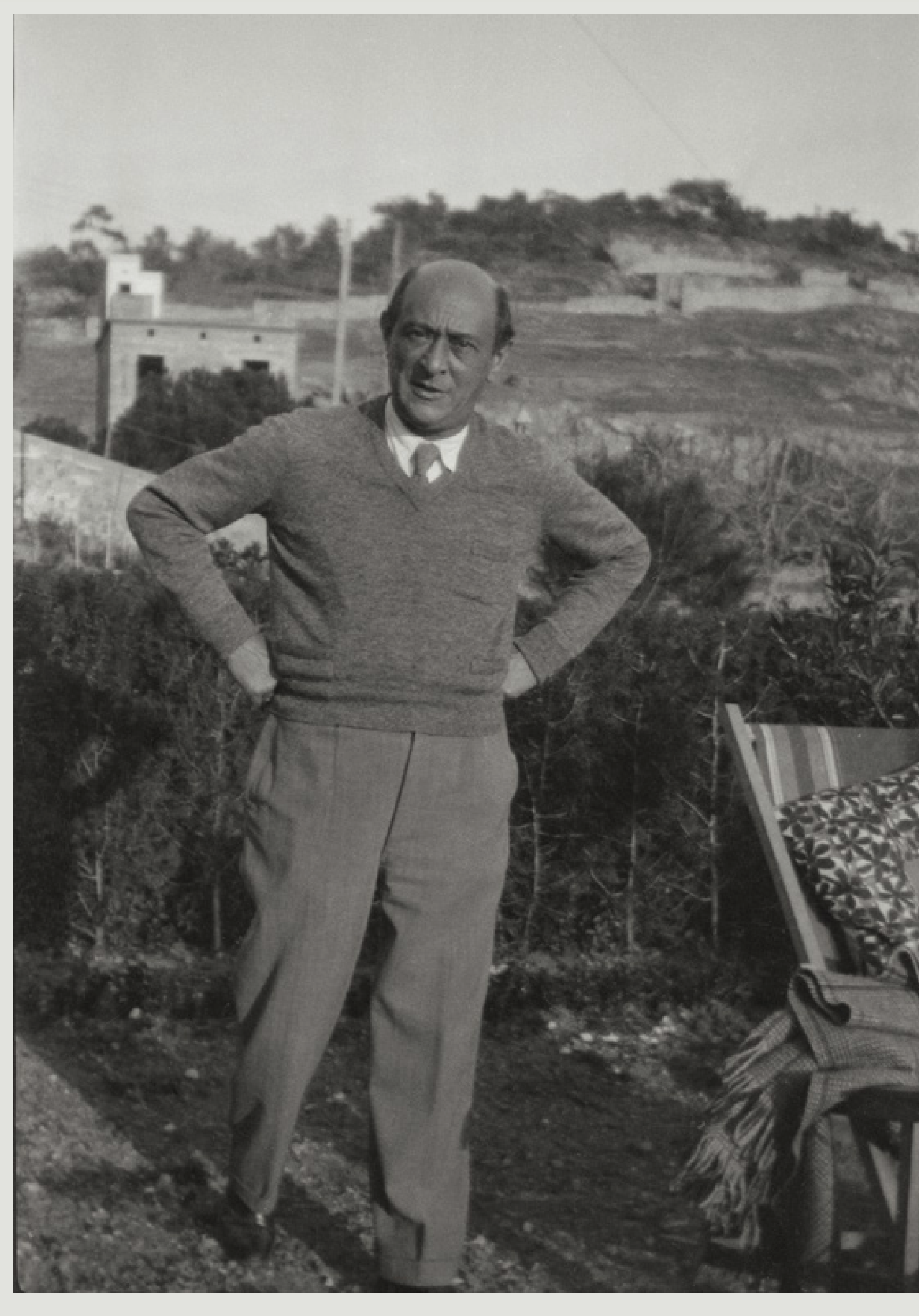
Arnold Schönberg, Barcelona, Baixada de Briz, 14 (1931/32).