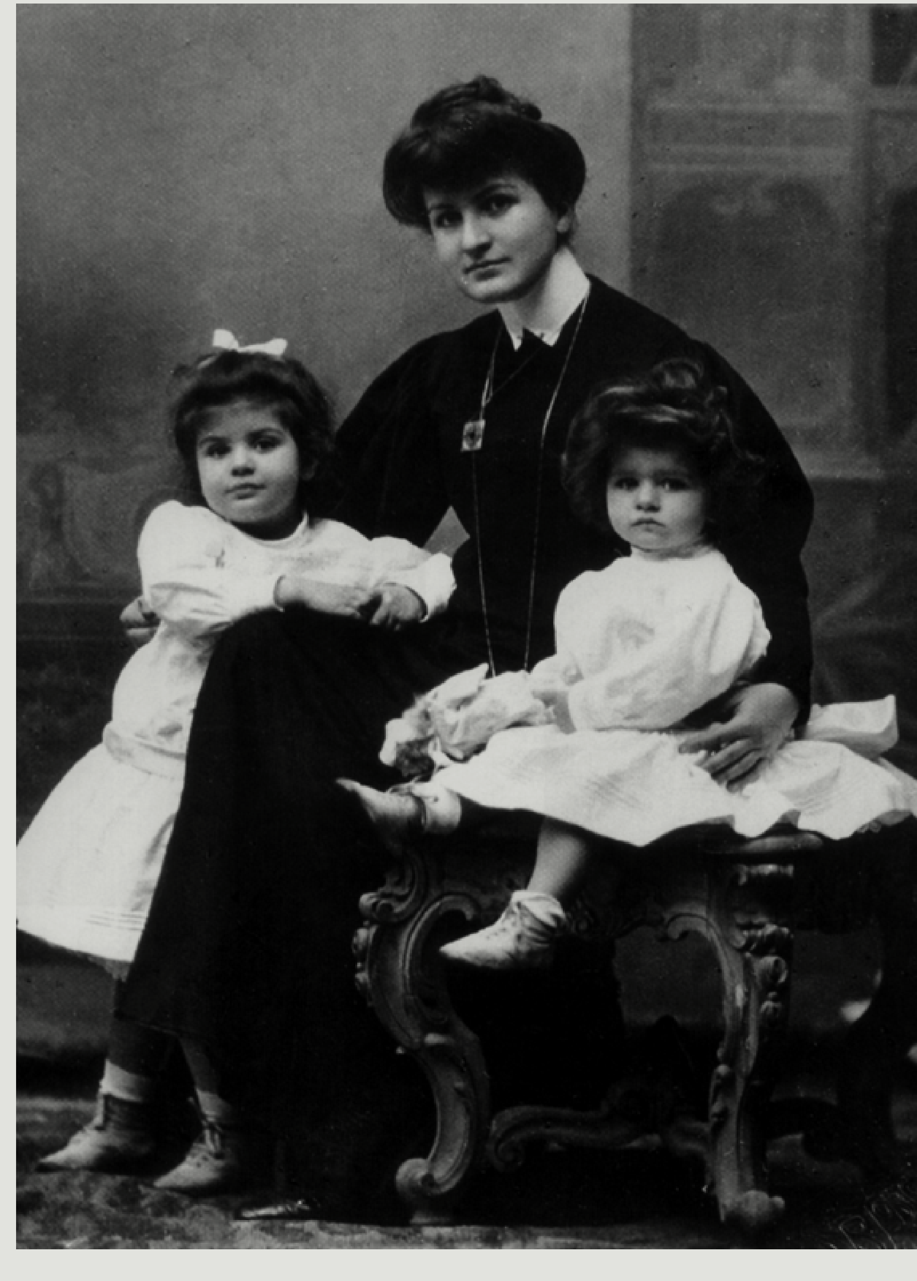
Alma Mahler i les seves filles Anna i Maria (1906).