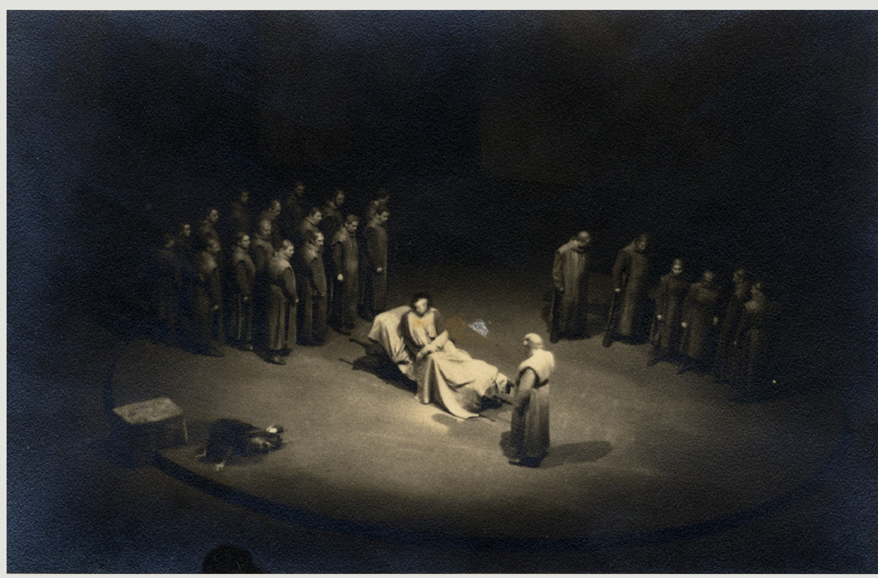
Parsifal , Festival de Bayreuth a Barcelona (1955).