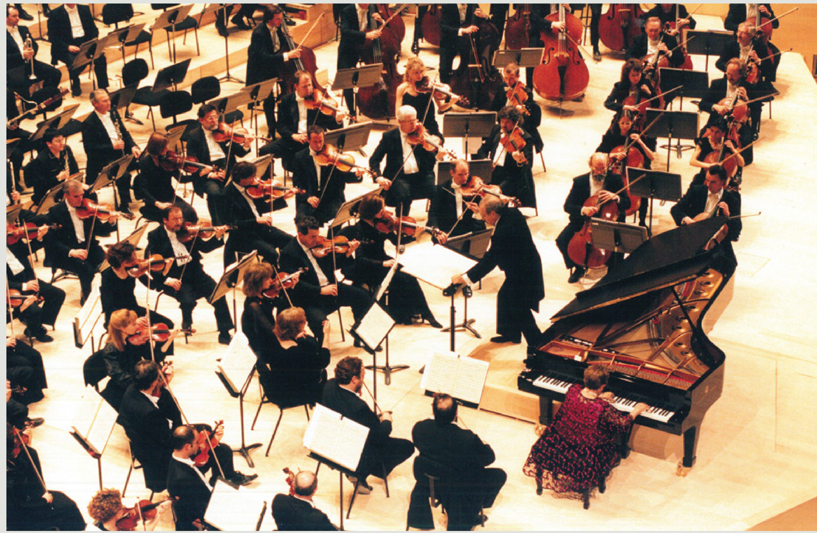
Alicia de Larrocha en el concert d'inauguració de L'Auditori. Foto d'Assumpta Burgués (1999). Fons: L'Auditori