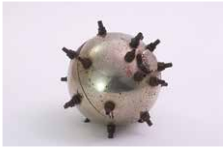
Bomba tipus Orsini. MUHBA.