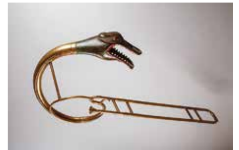
Buccén, Espanya o França, 1800-1860. MDMB 534. Museu de la Música de Barcelona.