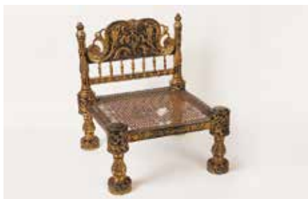
Cadeira de la Reina. MMP.