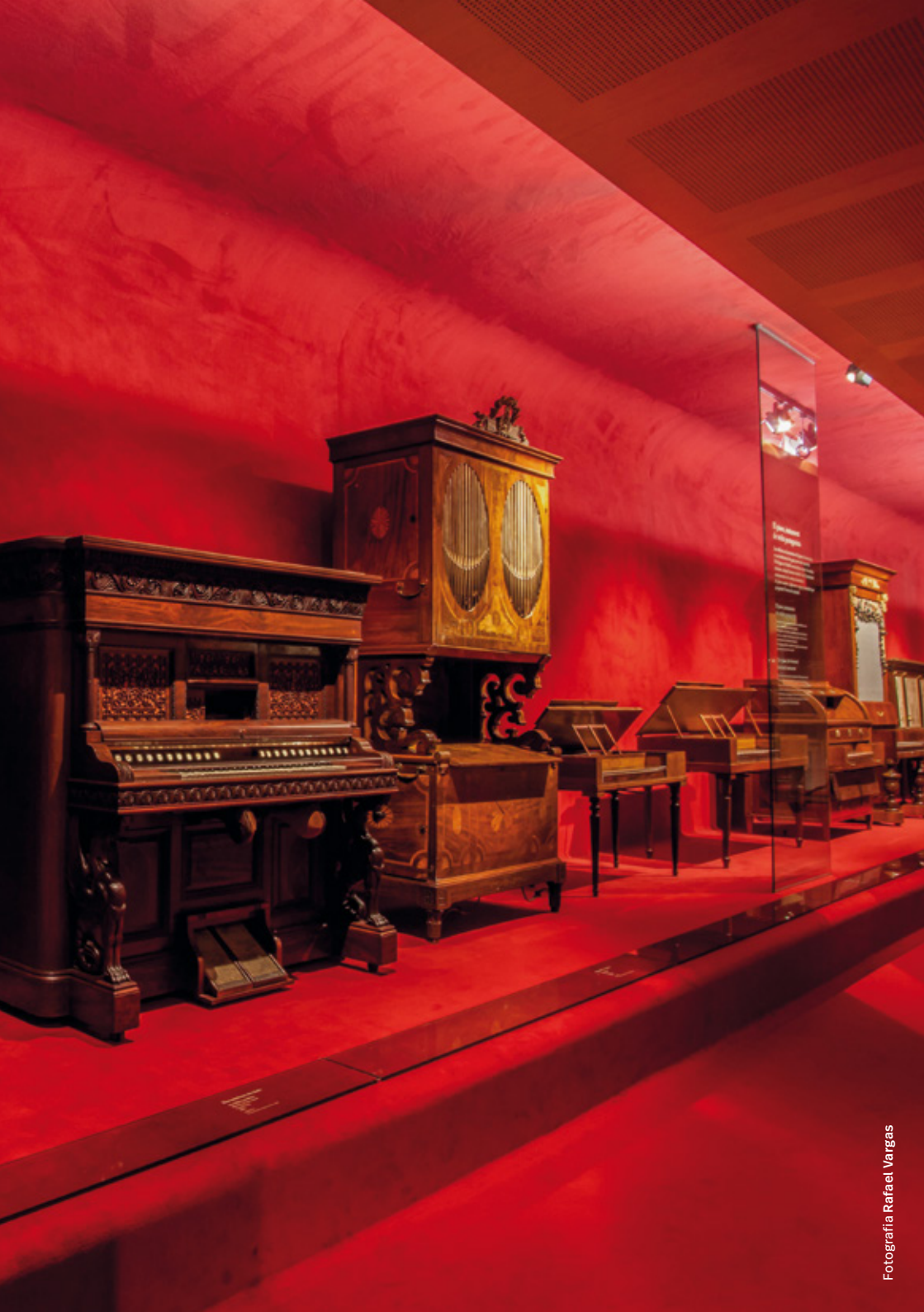
Fotografia Rafael Vargas