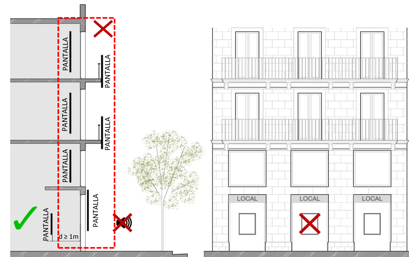
Figura 4: Condicions d'ubicació (Punt 2.1)