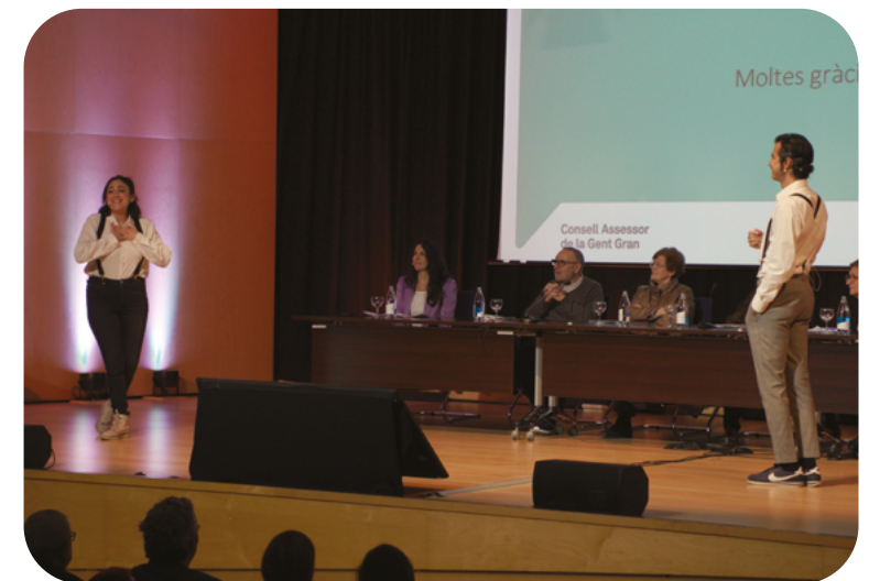
L'espectacle Impro Side Story

Després d'aquests parlaments, l'espectacle d'improvvisació Impro Side Story va posar el punt final a aquesta 6a Convenció Les veus de les persones grans.