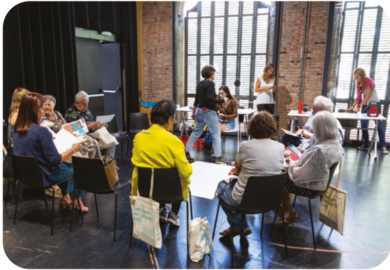
Grups de treball de persones grans