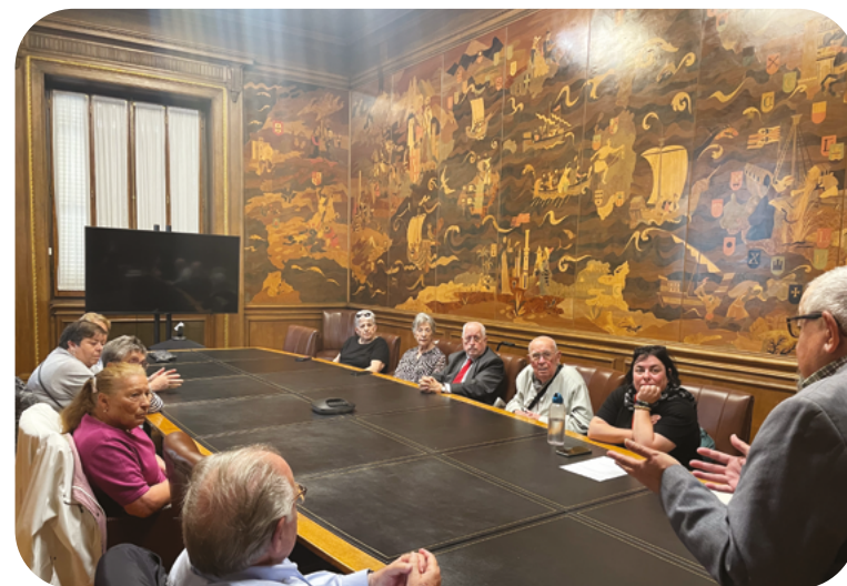
Sessió presencial de cloenda del grup de debat de la Convenció a VinclesBCN

El grup de debat específic va funcionar de novembre a març amb una freqüència setmanal. Una de les dinamitzadores del servei anava compartint els debats per tal que les persones usuàries de Vincles poguessin participar del procés de la Convenció impulsat pel CAGG. Totes les activitats s'anunciaven al canal, fent recordatoris específics en els grups territorials més propers als llocs on se celebraven les activitats per tal que les persones usuàries del canal també hi poguessin assistir presencialment si així ho volien. Els resultats d'aquests debats es van recopilar i es van incorporar al procés d'elaboració de conclusions. També