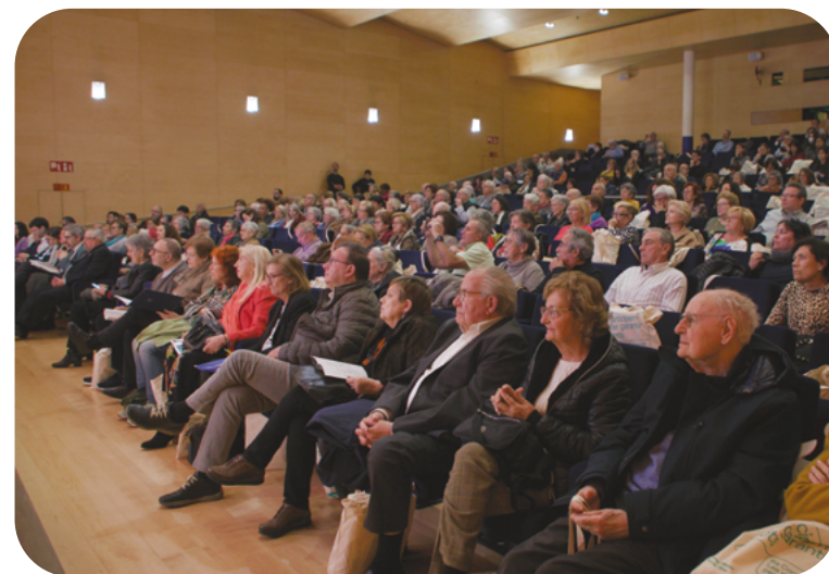
Assistents a la Jornada de Síntesi de la 6a Convenció Les veus de les persones grans a l'Auditori ONCE de Barcelona