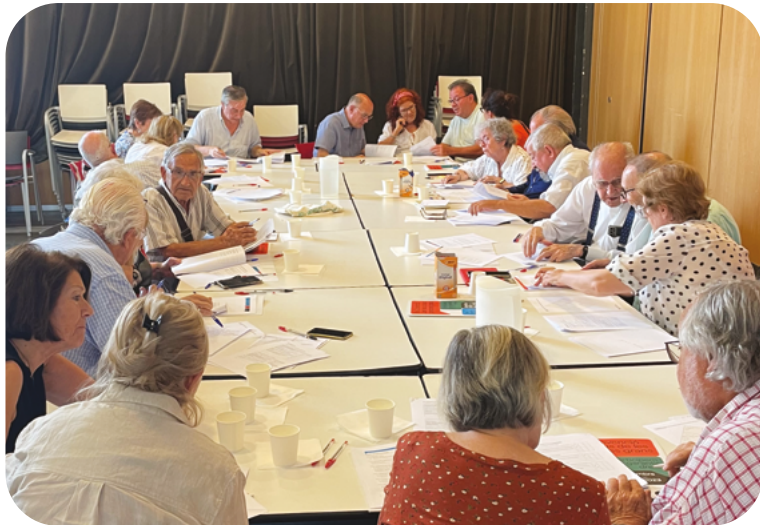
Grup motor de la 6a Convenció: sessió de treball del CAGG per a la definició del Pla de treball 2023-2027. 16 de juny de 2023