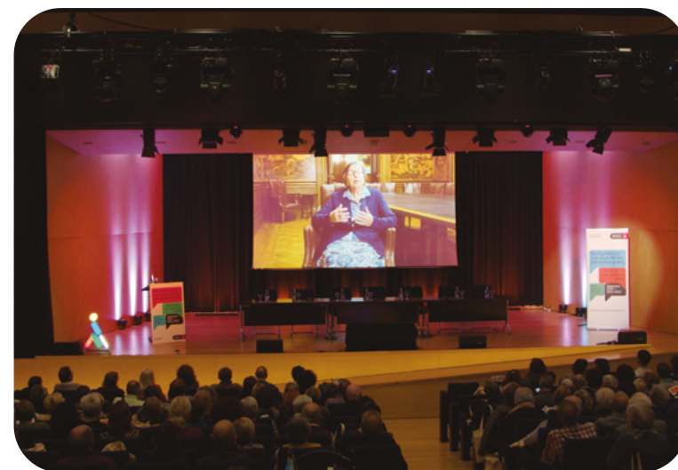
Jornada de síntesi de la 6a Convenció Les veus de les persones grans

La 3a jornada , que va dur el títol de Jornada de Síntesi , es va celebrar el 21 de març de 2023 i va posar el punt final a tots els actes de la 6a Convenció que, com hem explicat, van tenir lloc al llarg de 7 mesos. Com el seu títol indica, va ser una jornada de resum que va servir per extreure unes primeres conclusions i començar a concretar, a partir d'aquestes, les propostes que han de marcar el full de ruta dels propers 4 anys. Per aquest motiu, els continguts d'aquesta jornada s'expliquen dins l'apartat final de conclusions d'aquest document, que podeu consultar a la pàgina 94.