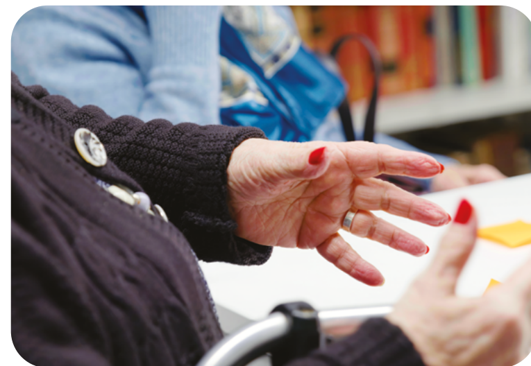
Debat a la residència Francesc Layret

A la residència de Fort Pienc també es va organitzar, a banda del debat amb els residents, un altre debat amb els seus familiars.