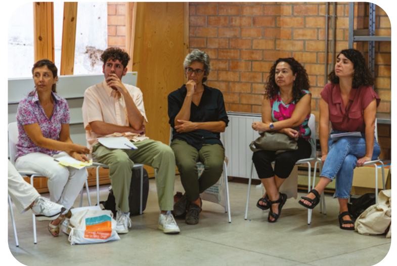
Grup de treball de professionals

A banda, els grups de professionals van dur a terme un treball analític sobre dues qüestions prioritàries i relacionades entre elles: la soledat no volguda i els projectes comunitaris . Es van analitzar diferents actuacions com Radars, VinclesBCN, Àpats en companyia, "Baixem al carrer", "En bici sense edat", VilaVeïna, la mateixa Convenció i diferents activitats i espais de trobada, i se'n va valorar la participació, els actors implicats i els pros i contres per fer-ne propostes de millora.