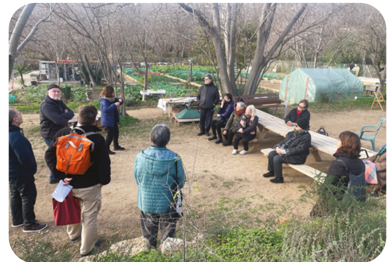
Grup de persones assistents a la visita a l'Hort Comunitari Pla i Armengol

Hort comunitari Pla i Armengol: hortplaiarmengol.org