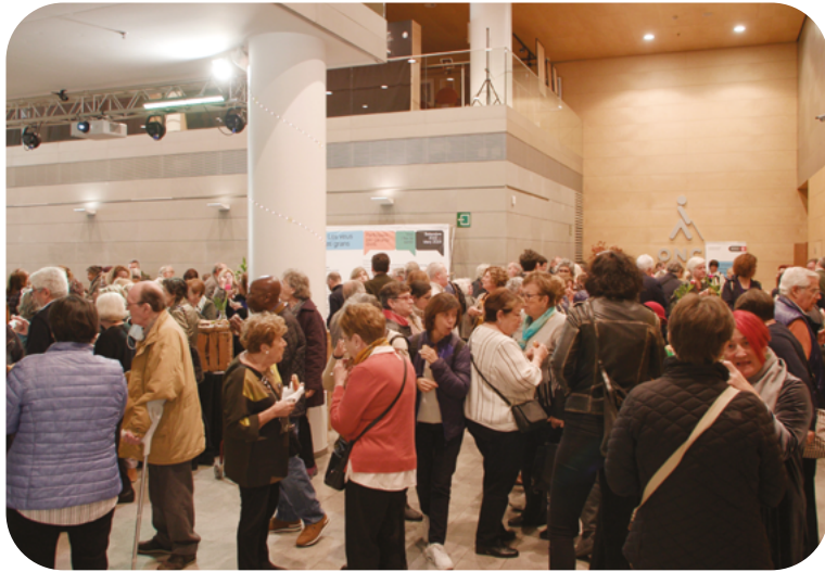
Entrada de l'Auditori ONCE, Jornada de Síntesi