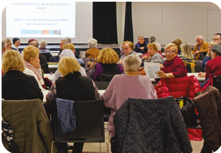
Debat al districte de Sant Andreu