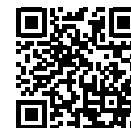
Estrena del curtmetratge A la bretxa . Cinemes Girona

Aquí podeu veure el curtmetratge A la bretxa :