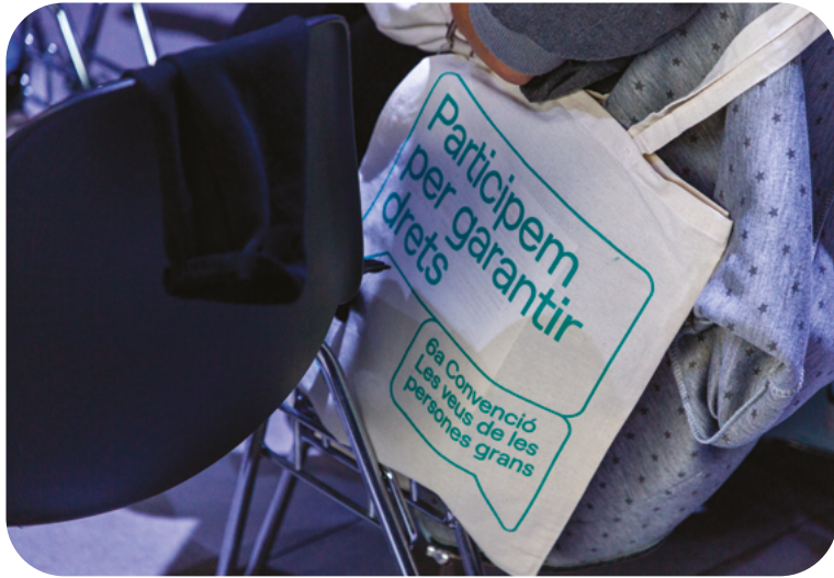
Assistents a la 2a Jornada: Avancem en la participació