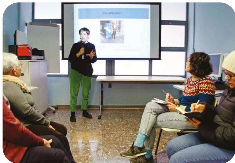
Visita als serveis VilaVeïna i Konsulta'm+22 en el casal La Vinya del barri de la Marina de Port

https://ajuntament.barcelona.cat/dretssocials/sites/default/files/arxius-document/diptic-konsulta-m-22-ca.pdf