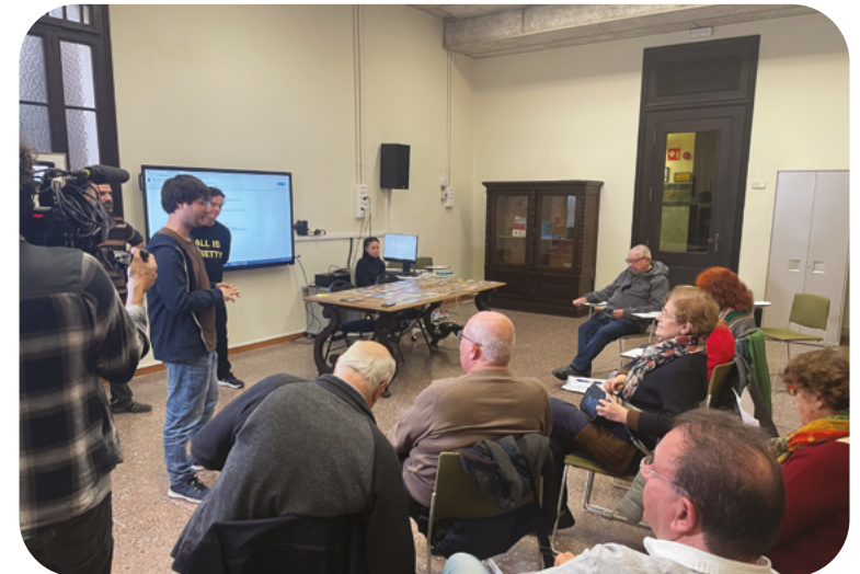
Sessió de treball del grup del CAGG que va participar en la cocreació del curtmetratge A la bretxa