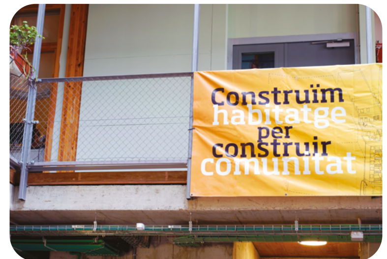
La cooperativa d'habitatge La Borda

Cooperativa d'habitatge sènior Can 70: https://sostrecivic.coop/projectes/can70