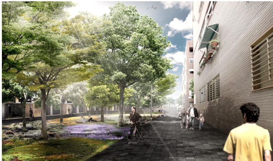
Imatge virtual carrer Uldecona

Les obres de millora de l'espai públic continuaran amb la urbanització del Carrer Uldecona, per donar continuïtat a les obres ja acabades al sector 10. Les obres que ja tenen el projecte aprovat, es licitaran durant el proper trimestre, i començaran a l'estiu.