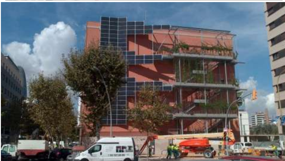
Mitgera del c. Ciutat de Granada, 106, abans de la remodelació. Abans i estat actual