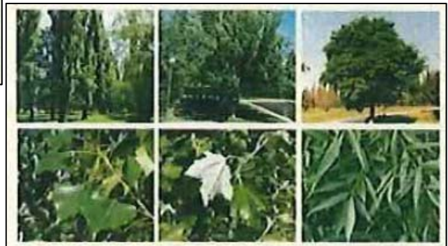
Espècies del node humit: Populus nigra (pollancre); Populus alba (xop blanc); Fraxinus angustifolia (Freixe de fulla petita)