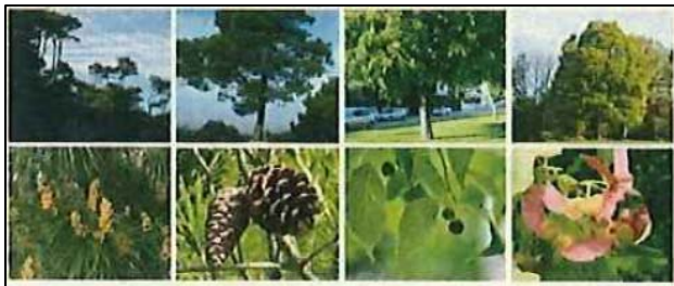
Espècies del node Canòpia: Pinus pinea (pi pinyoner); Pinus halepensis (pi blanc); Celtis australis (lledoner); Acer campestre (auró)

Els arbres del viver són espècies singulars i exòtiques que s'incorporaran al futur parc previst per Canòpia. Es distribuiran segons node exòtic al centre, exemplars de Canòpia al mig, node sec i humit als extrems.