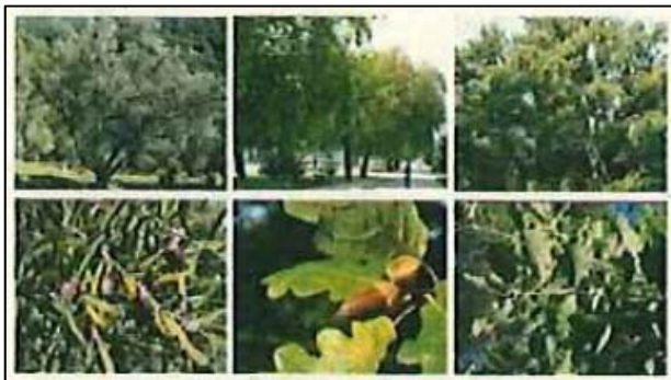
Espècies del node sec: Olea europaea sylvestris (ullastre); Quercus pubescens (alzina); Quercus cerrifolia (roure)