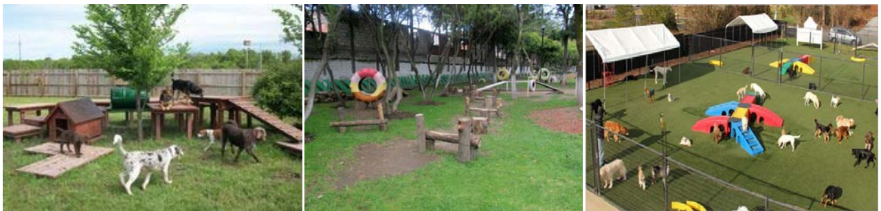
(*) Exemples dels elements de socialització que hi haurà a les zones d'esbarjo per a gossos

La regidoria de Presidència i Territori i el Col·legi Oficial de Veterinaris de Barcelona (COVB) estan treballant conjuntament per definir les característiques de les àrees d'esbarjo per gossos. Aquests espais, en funció de les seves dimensions i la seva ubicació, podran presentar diferències entre ells, però en tots els casos es garantirà que siguin còmodes per als seus usuaris, tant els animals com les persones, i segures.