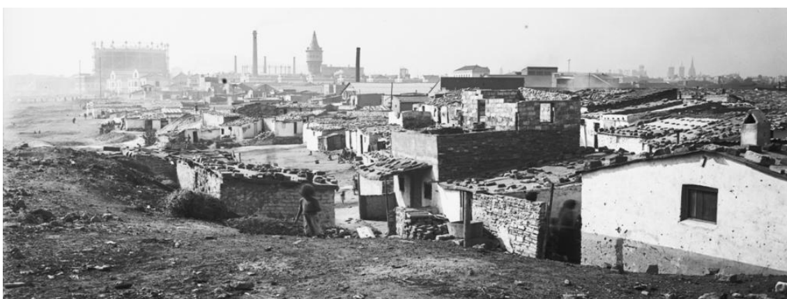
Barri del Somorrostro, c. 1950.