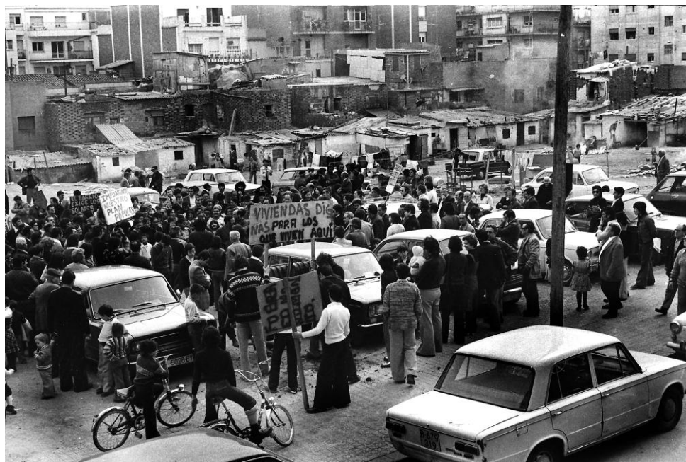
Assemblea veïnal al Pla de Santa Engràcia, 1977. Kim Manresa

Vivienda. Però es descobreix que els terrenys encara estan ocupats per activitats de Renfe, i això endarrereix la construcció dels pisos. Les obres comencen a principis dels anys 80, interrompudes en més d'una ocasió per dificultats econòmiques de les constructores.