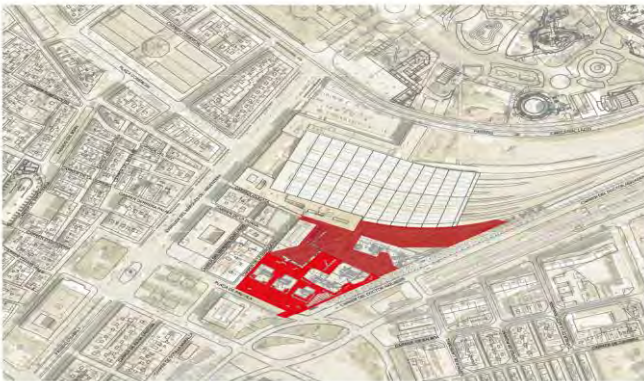
Àmbit d'actuació global (1a i 2a fase)

El projecte global d'urbanització d'aquest espai tenia com a objectiu la creació d'un espai públic per a vianants entre els edificis d'habitatges privats i l'actual edifici del Patronat Municipal de l'Habitatge (PMH) de Barcelona. Aquest espai pretén facilitar la comunicació entre els barris del Born i la Barceloneta.