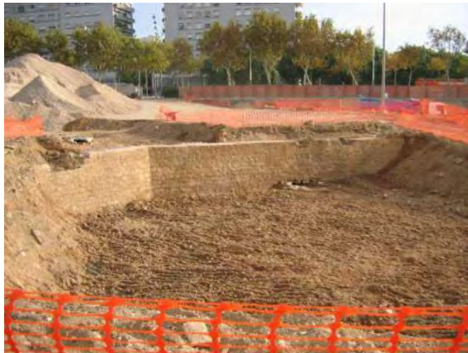
Tram de la contraescarpa documentat al solar del PMH

A més, es van documentar altres estructures que formarien part de les infraestructures ferroviàries del segle XIX i XX. Veient l'entitat de les restes que s'estaven localitzant, es va aturar la intervenció arqueològica i es va modificar el projecte urbanístic amb la finalitat de preservar les restes arqueològiques.