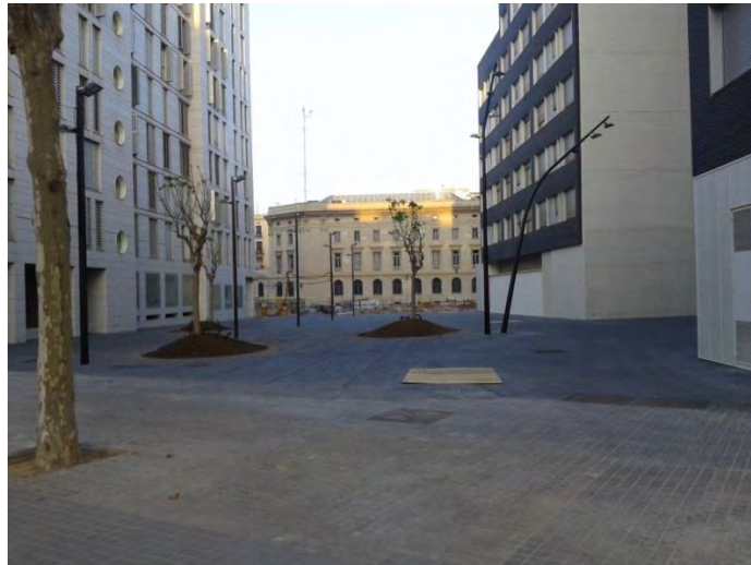
2a. Fase d'urbanització. Entorns de l'edifici del PMH

Entre l'edifici de PMH i l'Estació de França s'ha executat una zona d'estada i d'arbrat amb plantació amb un paviment sobre base drenant per garantir la màxima permeabilitat i drenatge del subsòl i per afavorir en aquest àmbit el millor comportament del subsòl pel creixement de l'arbrat. En el límit amb l'edificació del PMH s'ha col·locat el mateix paviment amb dimensions diferents i sobre llosa de formigó.