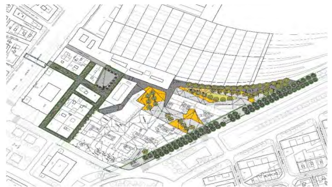
Àmbit de la 2a. Fase d'urbanització

La segona fase d'urbanització, que ha finalitzat ara, implica l'àmbit de 7.935,43 m 2 a l'entorn del nou edifici de protecció del Patronat Municipal de l'Habitatge i l'actuació a l'entorn del Baluard de Migdia, el que ha permès la seva recuperació i vista. Els treballs d'urbanització de la fase 2 han tingut un cost de 2 milions d'euros en l'àmbit delimitat pel carrer del Doctor Aiguader, el carrer de la Marquesa, els edificis adjacents al carrer Ocata i el pentinat de vies de tren de l'Estació de França fins al c/ Doctor Aiguader.