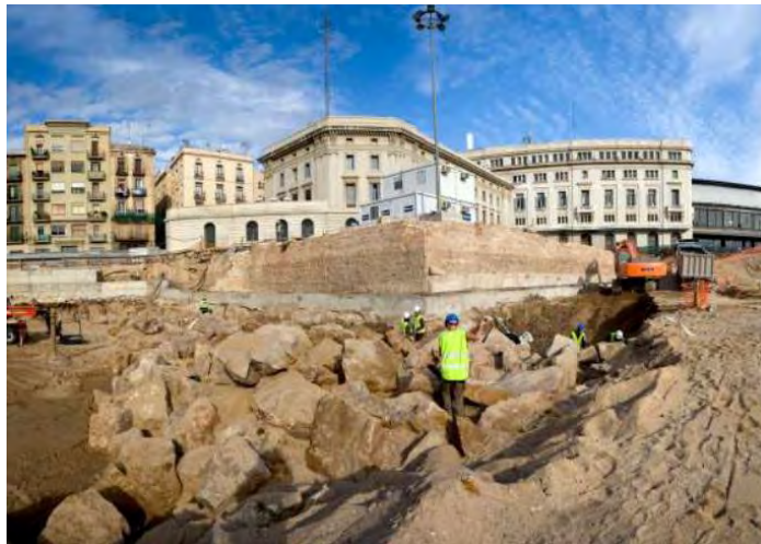
L'escullera del segle XV en procés d'excavació i el Baluard de Migdia

Entre d'altres troballes, i de manera cronològica respecte al moment de la seva construcció, cal citar la localització de l'escullera del port de Barcelona (segle XV), el Baluard de Migdia i la muralla (a partir de 1527), la contraescarpa (segle XVIII) i una sèquia canalitzada associada a la contraescarpa, un tram de canalització d'una derivació del Rec Comtal (posterior a 1735), restes de la muralla del segle XIX construïda per a permetre la nova urbanització del Pla de Palau i diverses estructures ferroviàries (segles XIX i XX).