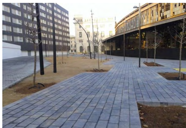
2a. Fase d'urbanització. Entorns de l'edifici del PMHB

La decisió de mantenir vistes les restes del baluard -una vegada feta l'excavació arqueològica completa segons el Pla d'Intervenció del Servei d'Arqueologia- obligava el projecte d'urbanització d'aquesta segona fase a recollir tots aquells elements de protecció com ara baranes, tanques i accessos per poder dur a terme visites guiades i tasques de manteniment a l'espai d'interès arqueològic.