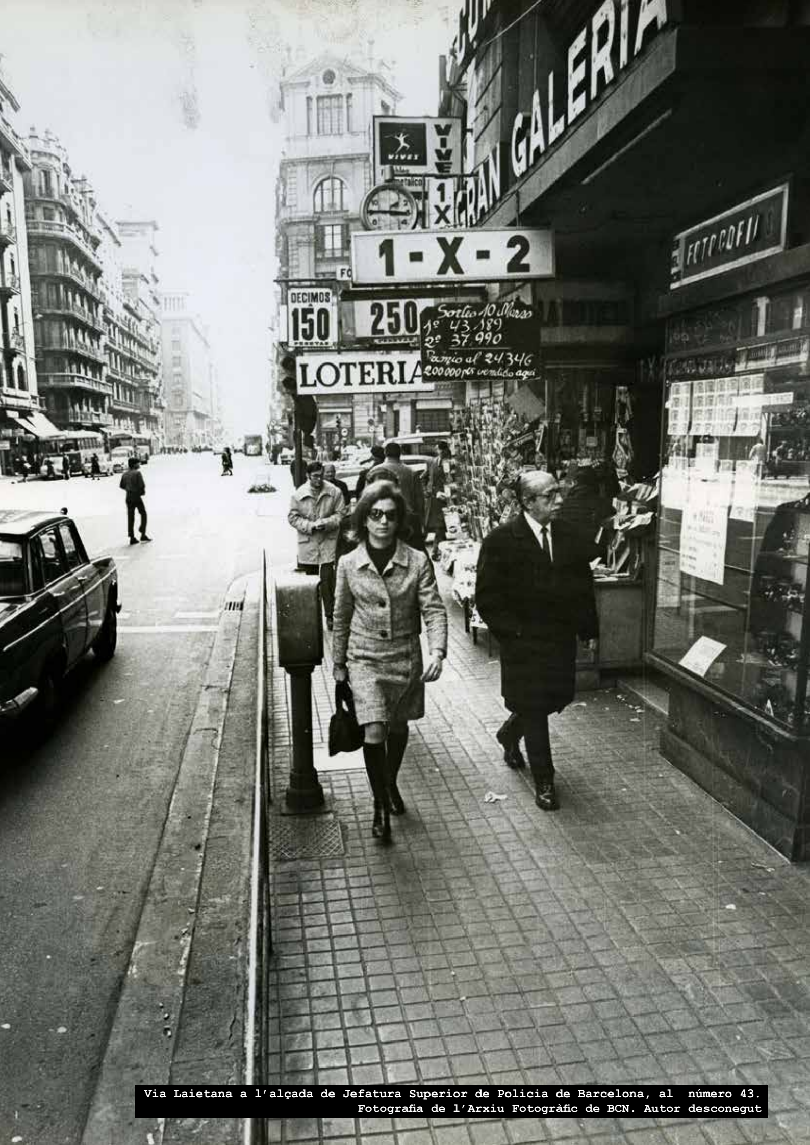
Via Laietana a l'alçada de Jefatura Superior de Policia de Barcelona, al número 43.